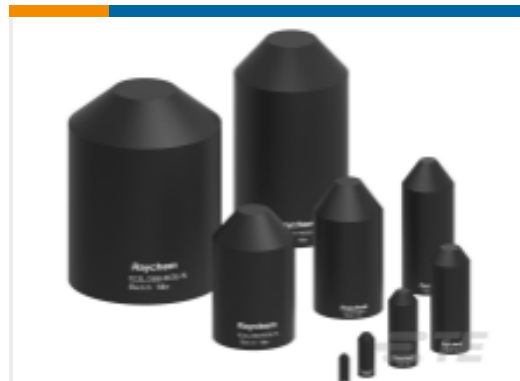
TE 产品编号BM5710N001 102L033-R05/S(S25)