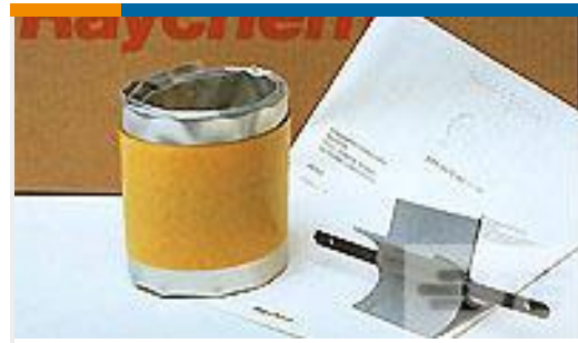
TE 产品编号485455-000 RDSS-150(S10)