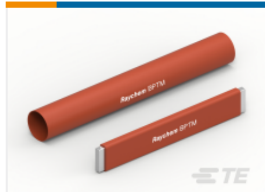
TE 产品编号224624-000 BPTM-50/20-A/U-4(S30)