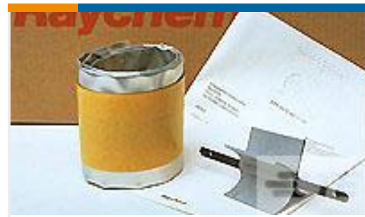
TE 产品编号588693-000 RDSS-125(S10)