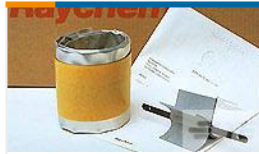
TE 产品编号741939-000 RDSS-CLIP-150(S5)