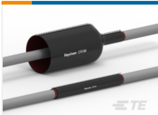
TE 产品编号832439-000 用于电缆维修的拉链套管