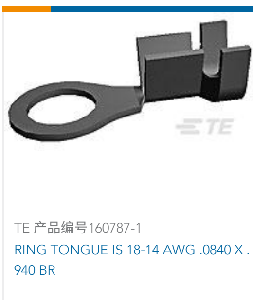
TE 产品编号160787-1 RING TONGUE IS 18-14 AWG .0840 X .940 BR