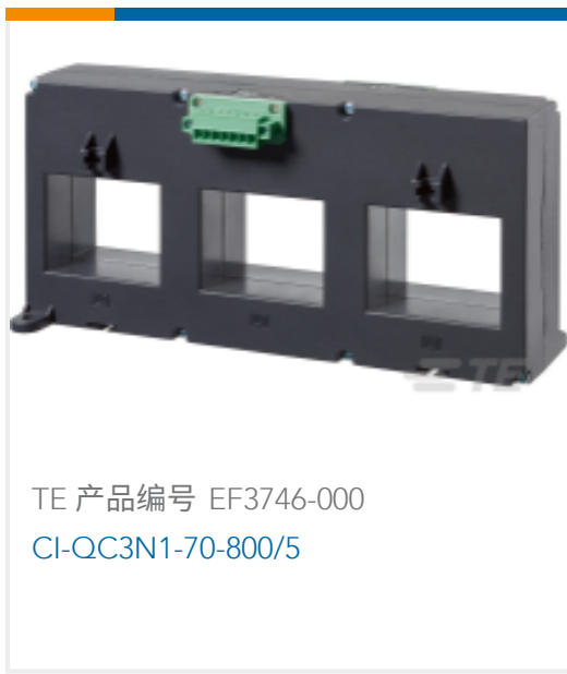
TE 产品编号 EF3746-000 CI-QC3N1-70-800/5