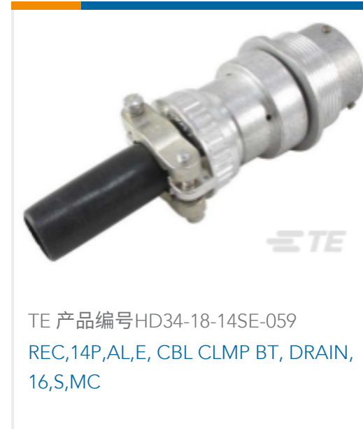
TE 产品编号HD34-18-14SE-059 REC,14P,AL,E, CBL CLMP BT, DRAIN, 16,S,MC