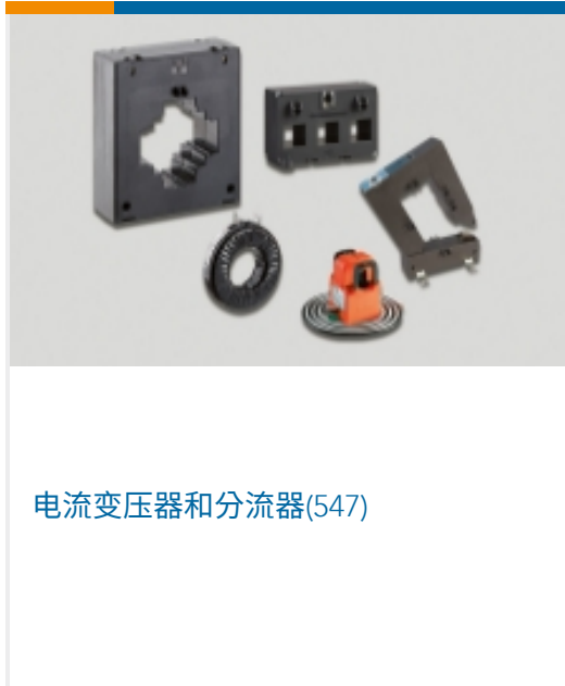
电流变压器和分流器(547)