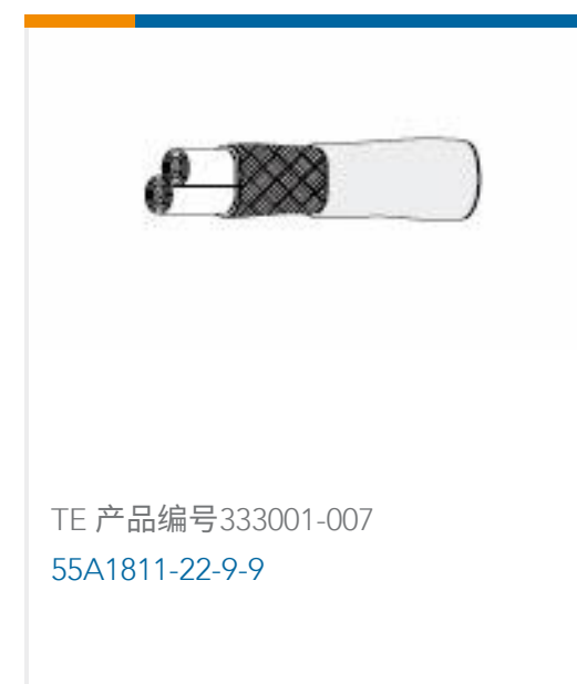
TE 产品编号333001-007 55A1811-22-9-9