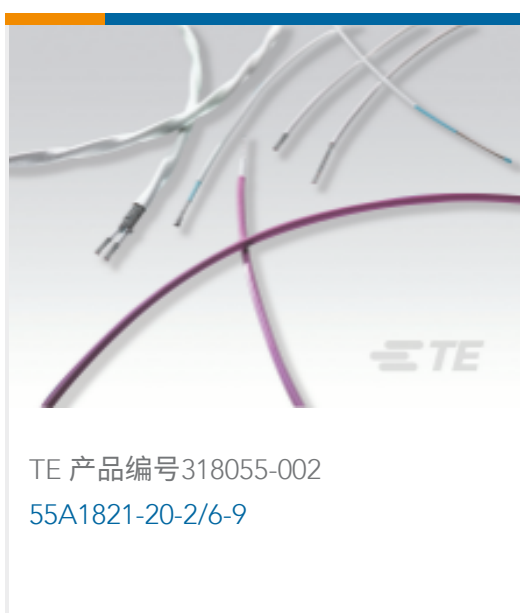
TE 产品编号318055-002 55A1821-20-2/6-9