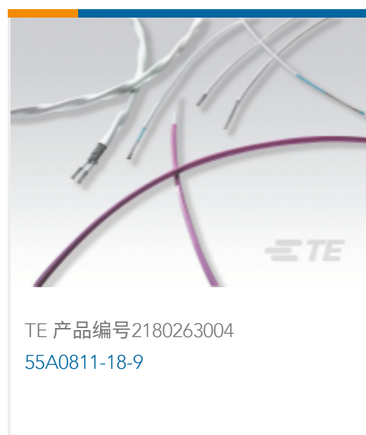
TE 产品编号2180263004 55A0811-18-9