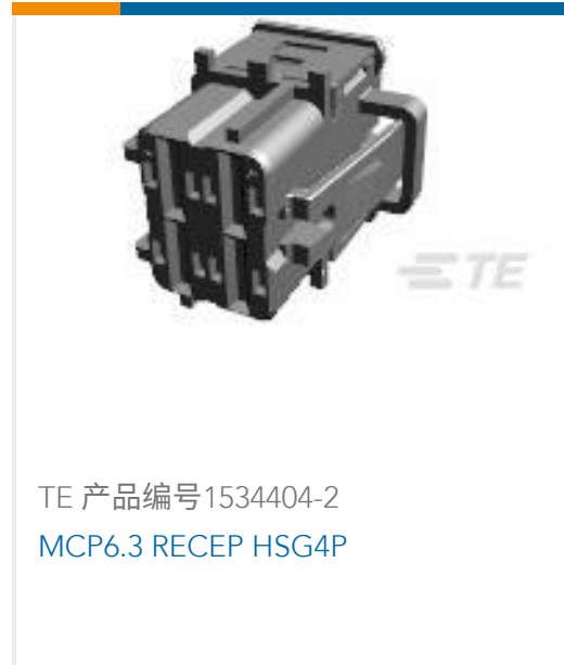
TE 产品编号1534404-2 MCP6.3 RECEP HSG4P