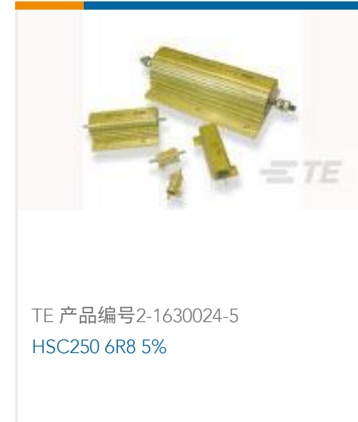
TE 产品编号2-1630024-5 HSC250 6R8 5%