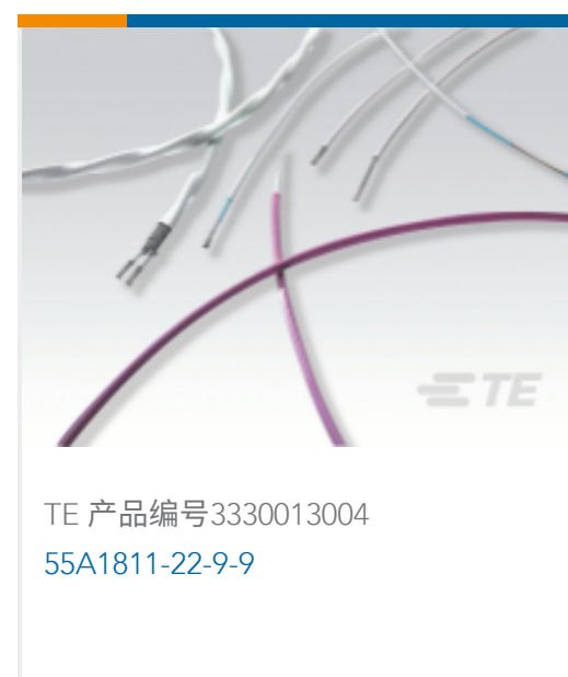
TE 产品编号3330013004 55A1811-22-9-9