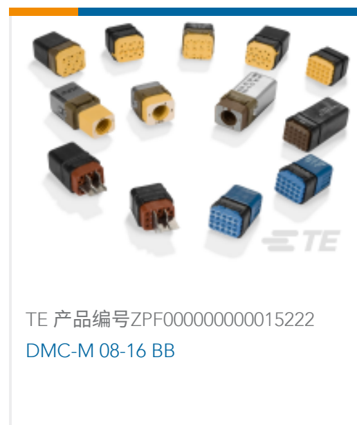
TE 产品编号ZPF000000000015222 DMC-M 08-16 BB