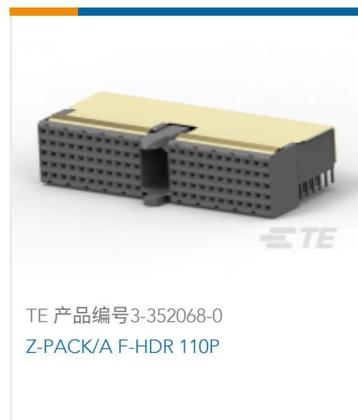
TE 产品编号3-352068-0 Z-PACK/A F-HDR 110P