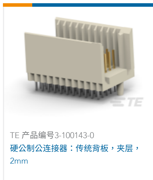
TE 产品编号3-100143-0 硬公制公连接器：传统背板，夹层， 2mm