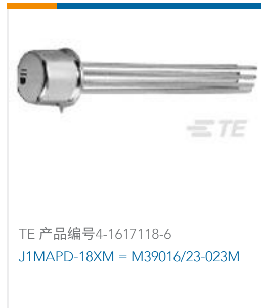
TE 产品编号4-1617118-6 J1MAPD-18XM = M39016/23-023M