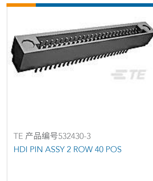
TE 产品编号532430-3 HDI PIN ASSY 2 ROW 40 POS