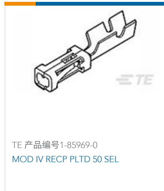
TE 产品编号1-85969-0 MOD IV RECP PLTD 50 SEL