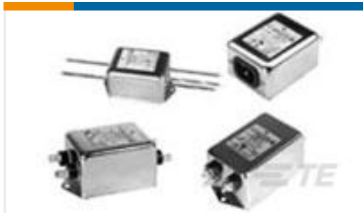
TE 产品编号1-6609031-2 SER7M=F7188 S0