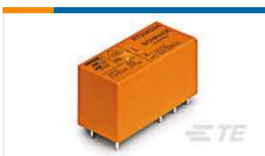
TE 产品编号1393244-2 RT444048