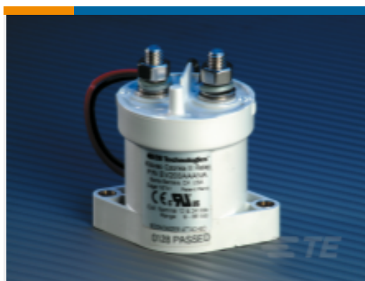
TE 产品编号1-1618002-6 EV200H2ANA=RELAY, SPST-NO W /AUX