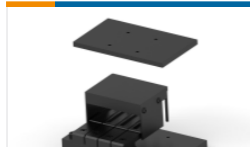
TE 产品编号1-2215056-4 ASSY, EXTRACT TL, QSFP28 1X4