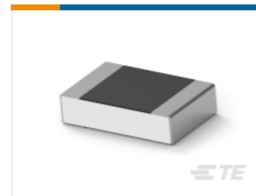
TE 产品编号1-2176377-3 RQ 0805 178K 0.1% 10PPM 1K RL