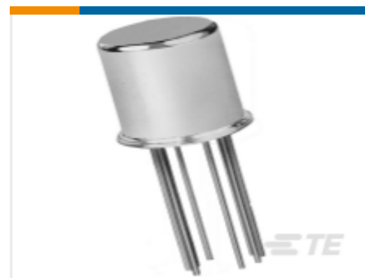
TE 产品编号1617126-3 JMAWD-18XL = M39016/15-032L