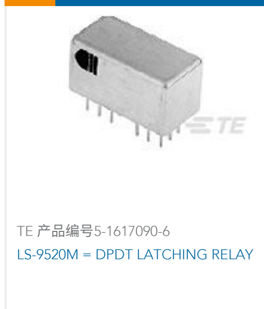
TE 产品编号 5-1617090-6 LS-9520M = DPDT LATCHING RELAY