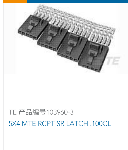
TE 产品编号 103960-3 5X4 MTE RCPT SR LATCH .100CL