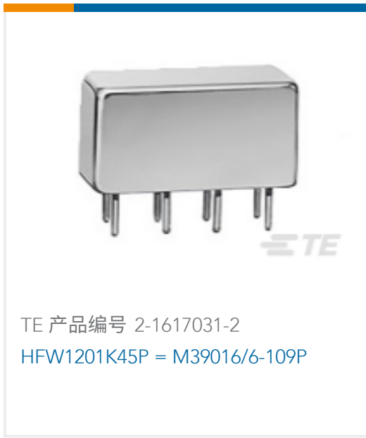
TE 产品编号 2-1617031-2 HFW1201K45P = M39016/6-109P