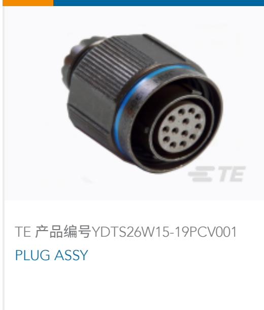
TE 产品编号 YDTS26W15-19PCV001 PLUG ASSY