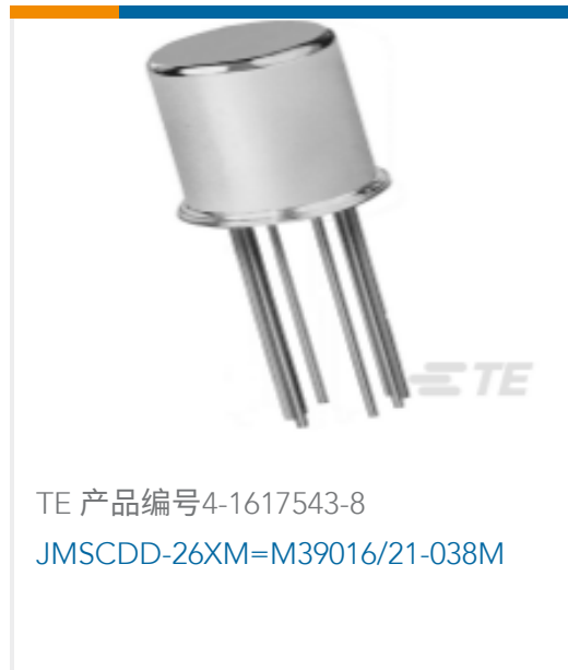
TE 产品编号 4-1617543-8 JMSCDD-26XM=M39016/21-038M