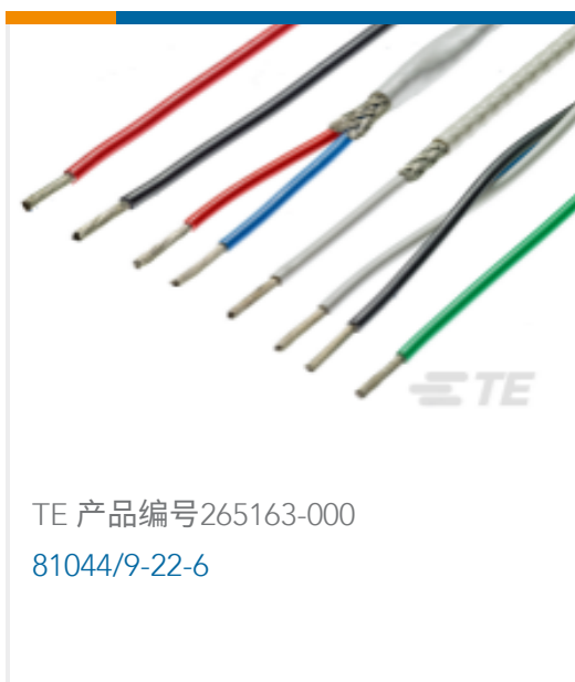
TE 产品编号 265163-000 81044/9-22-6