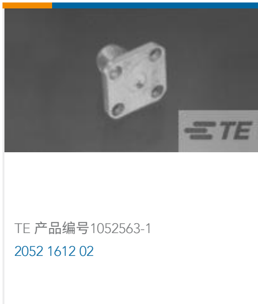
TE 产品编号 1052563-1 2052 1612 02