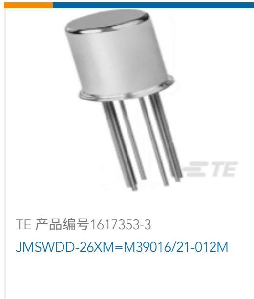
TE 产品编号 1617353-3 JMSWDD-26XM=M39016/21-012M