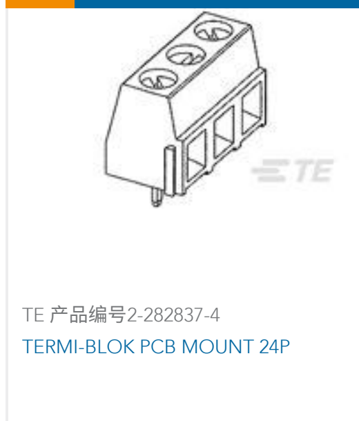
TE 产品编号 2-282837-4 TERMI-BLOK PCB MOUNT 24P