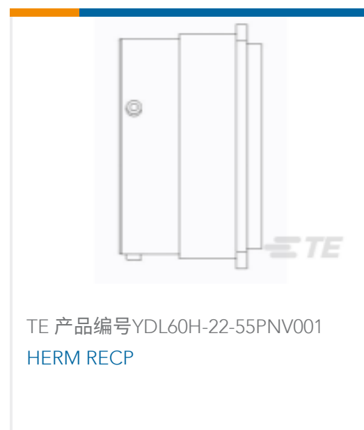
TE 产品编号YDL60H-22-55PNV001 HERM RECP