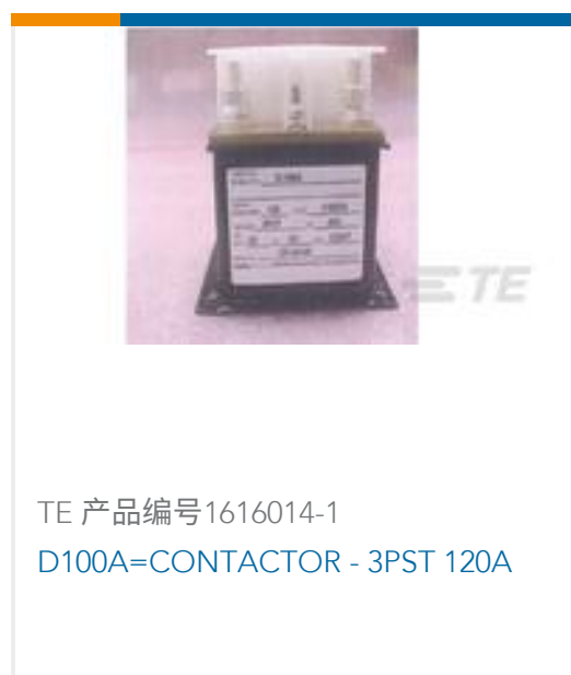
TE 产品编号1616014-1 D100A=CONTACTOR - 3PST 120A