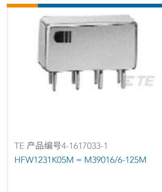
TE 产品编号4-1617033-1 HFW1231K05M = M39016/6-125M