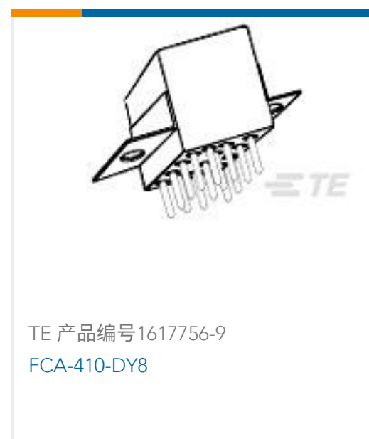
TE 产品编号1617756-9 FCA-410-DY8