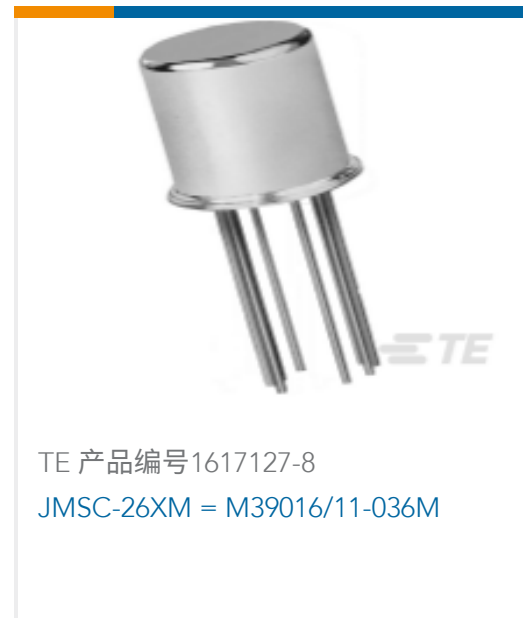
TE 产品编号1617127-8 JM5C-26XM = M39016/11-036M