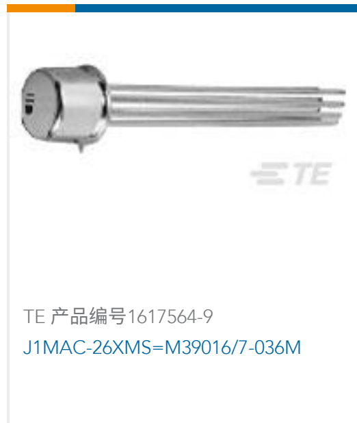
TE 产品编号1617564-9 J1MAC-26XMS=M39016/7-036M