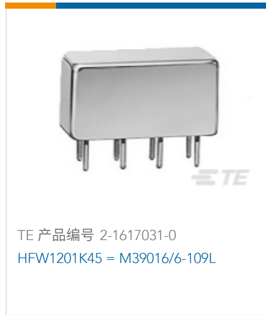
TE 产品编号 2-1617031-0 HFW1201K45 = M39016/6-109L