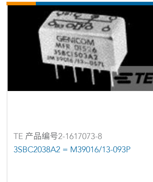
TE 产品编号2-1617073-8 3SBC2038A2 = M39016/13-093P