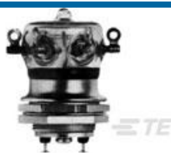
TE 产品编号 3-1618273-1 H-18/12VDC=RELAY, VACUUM, DPDT