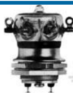
TE 产品编号 3-1618273-0 H-18/115VDC=RELAY, VACUUM