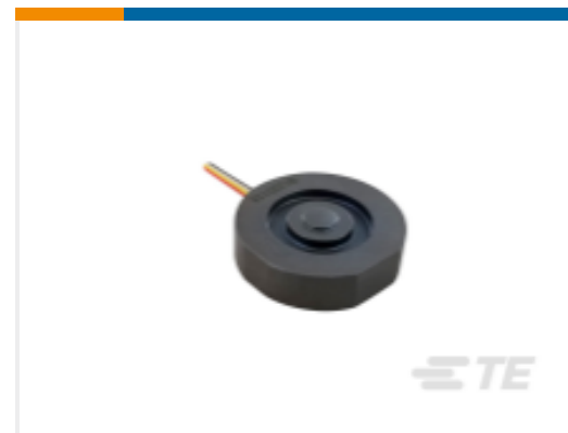
TE 产品编号20009605-09 FX293X-040B-0025-L