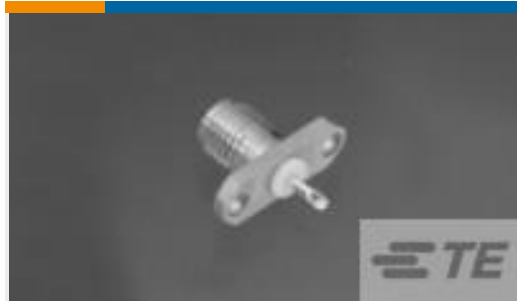
TE 产品编号1052928-1 2052 8003 92