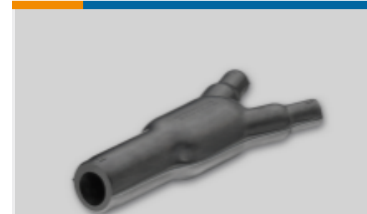
TE 产品编号163549-000 382A034-25/42-0