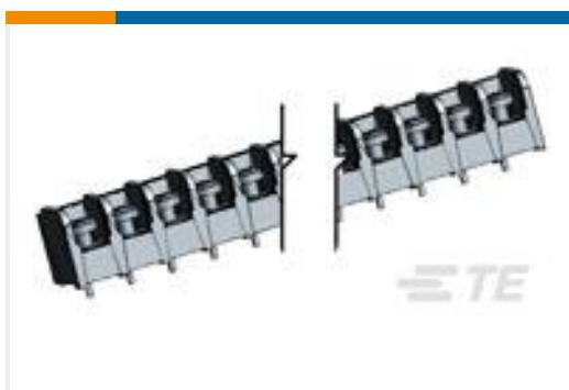
TE 产品编号4-1437658-0 8PCV-11-006=8PCV