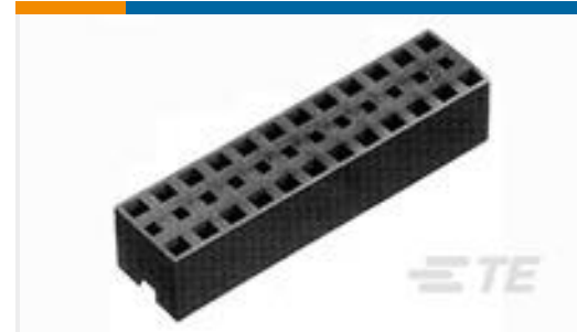
TE 产品编号390102-1 SHUNT, MULTI-POS 2X2 W/HANDLE