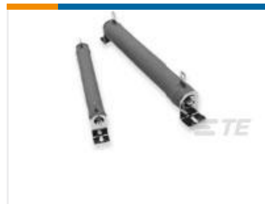
TE 产品编号3-1879447-2 TE 200W 390R 5% Bracket