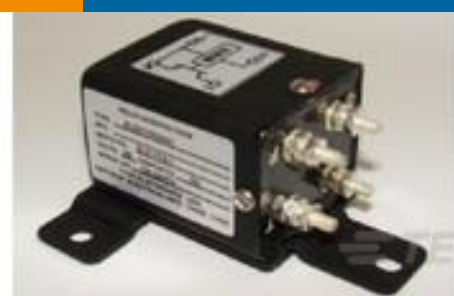
TE 产品编号 8-1616960-9 E311TS1=RELAY