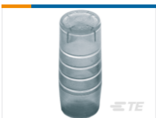
TE 产品编号398064-000 GURO-CEC-24/34