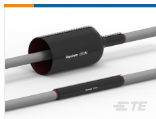
TE 产品编号 CAT-CRSM 用于电缆维修的拉链套管