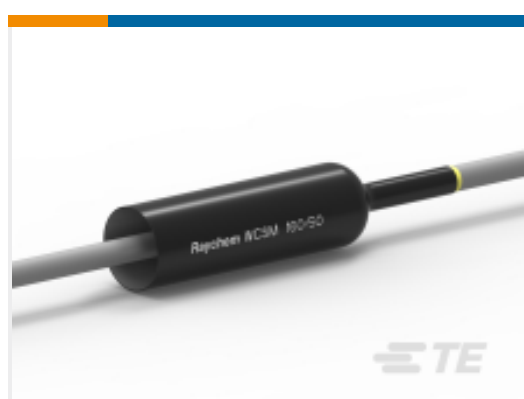
TE 产品编号CU8542-000 厚壁热缩管