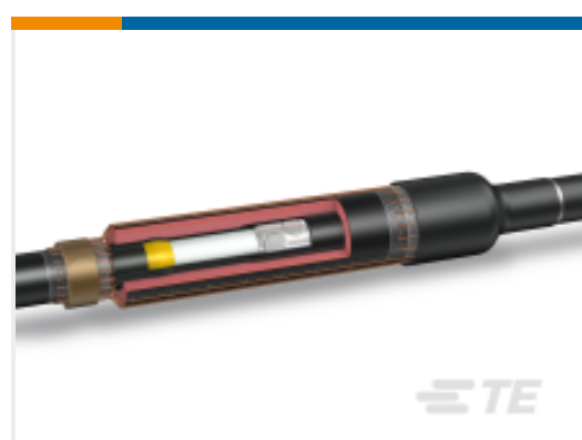
TE 产品编号A94128-068 POLJ-24/1X70-150