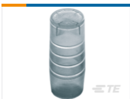
TE 产品编号548978-000 GURO-CEC-30/38