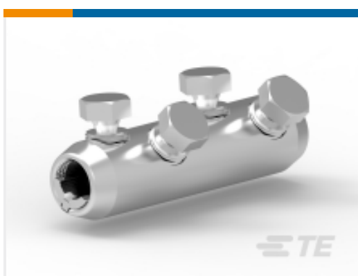
TE 产品编号 CAT-BSM 机械式接管和维修套管