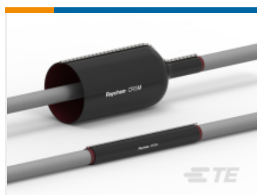
TE 产品编号406345-000 CRSM-34/10-1000/239(S5)