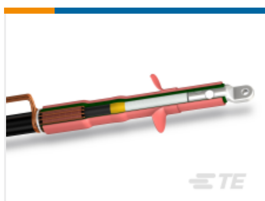
TE 产品编号C25441-061 POLT-42D/1XO