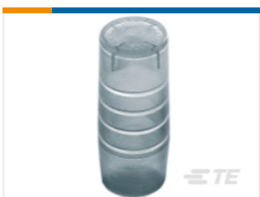
TE 产品编号926542-000 GURO-CEC-20/26