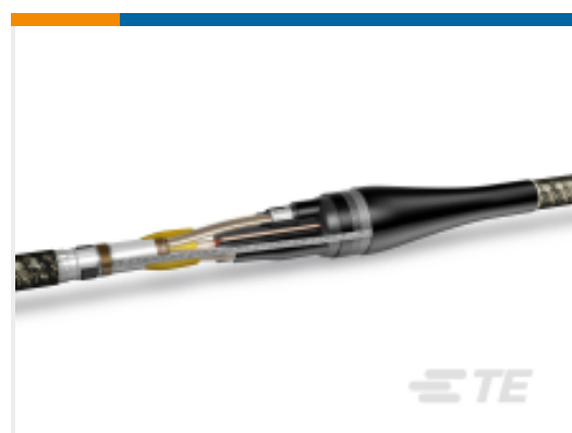
TE 产品编号A52349-070 GUSJ-12/70-120