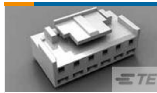
TE 产品编号2-1123722-3 3.96 EP PLUG HSG 3P(YELLOW)