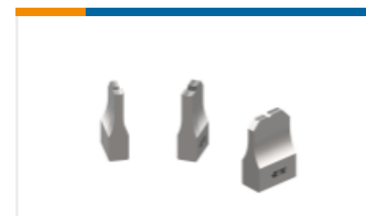
TE 产品编号1803337-1 ANVIL, COMBINATION