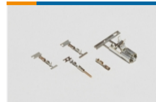
线到板连接器端子(32)