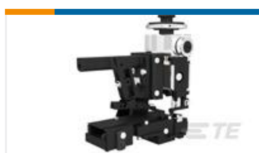
TE 产品编号2266030-1 OC-AT-S-FM-039F063F-070-1170