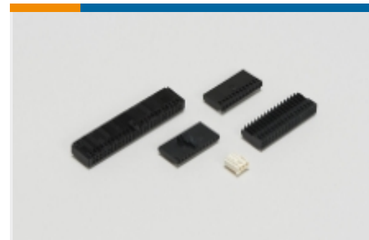
线到板连接器组件和护套(585)