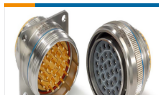
TE 产品编号ZPF00000000009137 983-7SE 12-12 PN