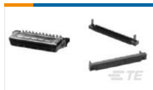
TE 产品编号750913-2 26 50SR CABLE CONN KIT