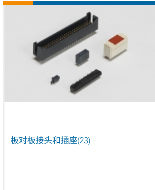
板对板接头和插座(23)