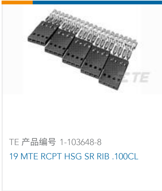
TE 产品编号 1-103648-8 19 MTE RCPT HSG SR RIB .100CL