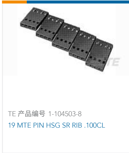
TE 产品编号 1-104503-8 19 MTE PIN HSG SR RIB .100CL