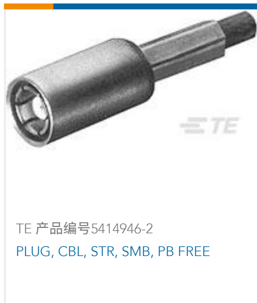
TE 产品编号 5414946-2 PLUG, CBL, STR, SMB, PB FREE