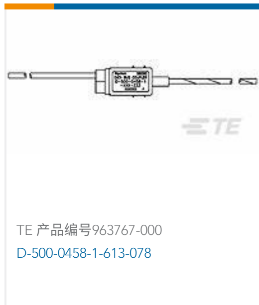
TE 产品编号 963767-000 D-500-0458-1-613-078