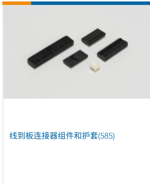
线到板连接器组件和护套(585)