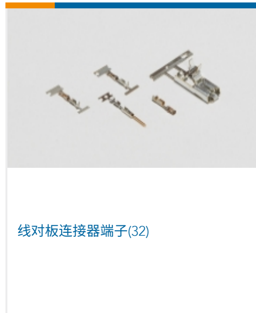
线对板连接器端子(32)