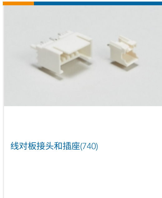
线对板接头和插座(740)