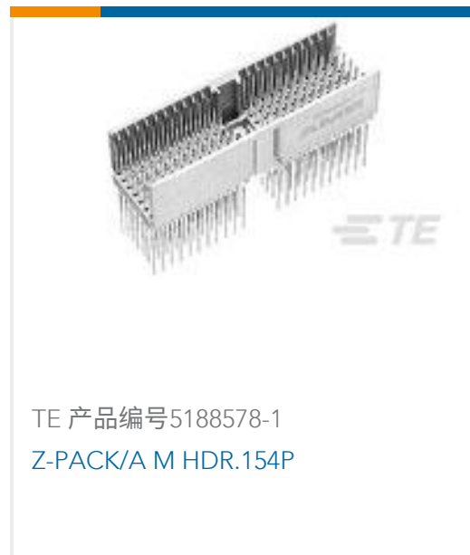
TE 产品编号 5188578-1 Z-PACK/A M HDR.154P