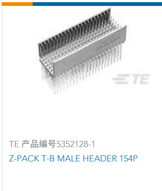
TE 产品编号 5352128-1 Z-PACK T-B MALE HEADER 154P