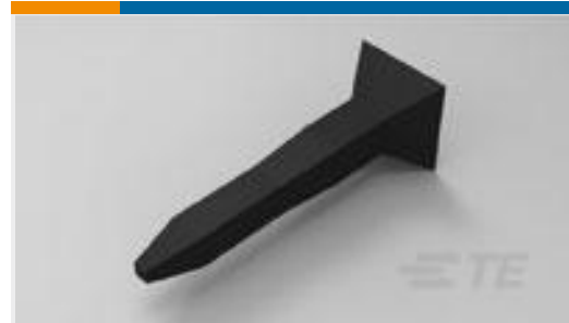
TE 产品编号499712-1 KEYING PLUG, NOVO RCPT