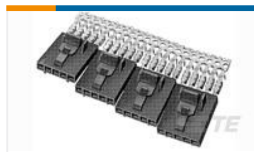
TE 产品编号5-103957-7 2X8 MTE RCPT SR LATCH .100CL