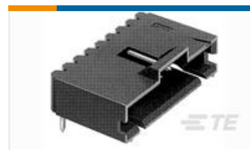
TE 产品编号5-103634-7 08 MTE HDR SRRA LATCH.100CL LF