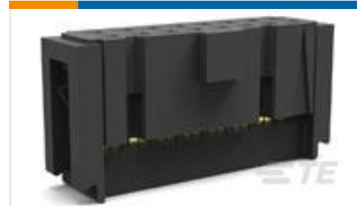
TE 产品编号1658527-9 622-2630LF FEM SOCKET, LEAD FREE