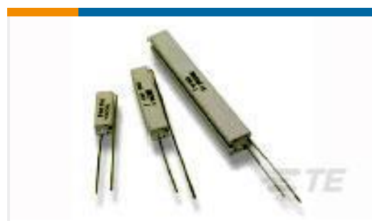
TE 产品编号1-1623729-7 BCHE 17 W 33R 5%