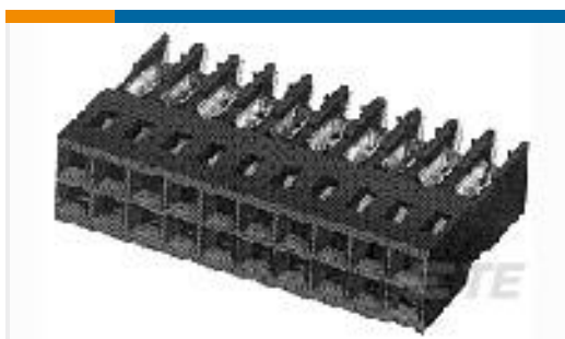
TE 产品编号 1-102394-4 32 AMP MODU MT HSG DR .100CL