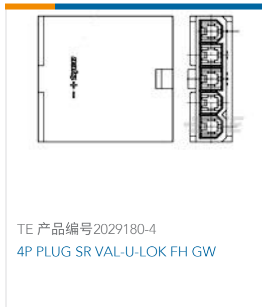
TE 产品编号2029180-4 4P PLUG SR VAL-U-LOK FH GW