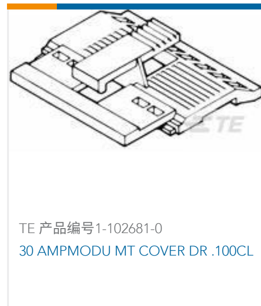
TE 产品编号1-102681-0 30 AMPMODU MT COVER DR .100CL