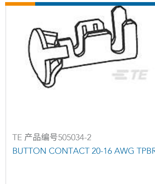
TE 产品编号505034-2 BUTTON CONTACT 20-16 AWG TPBR