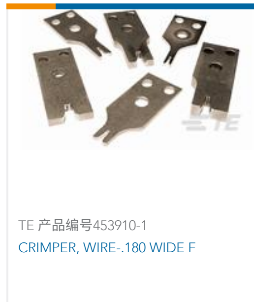
TE 产品编号453910-1 CRIMPER, WIRE-.180 WIDE F