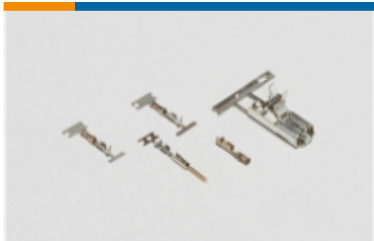
线对板连接器端子(66)