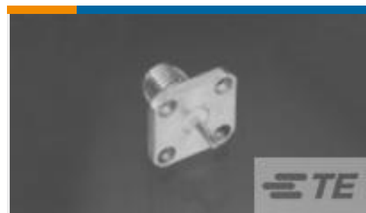
TE 产品编号1052511-1 2052 1132 00