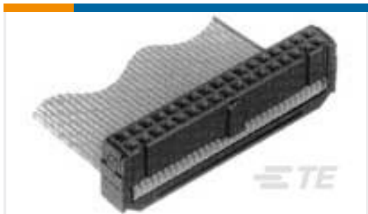
TE 产品编号1658622-6 26 NOVO MIL/CTR 30DP,LEAD FREE