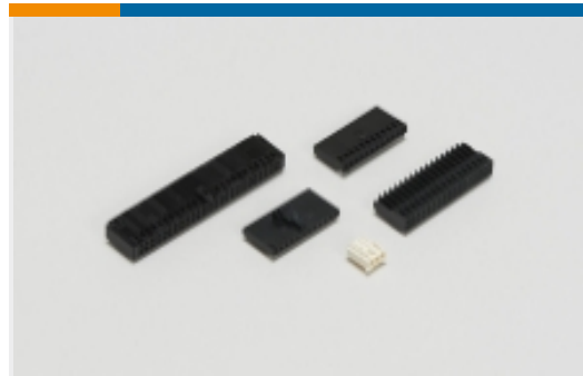
线到板连接器组件和护套(5)