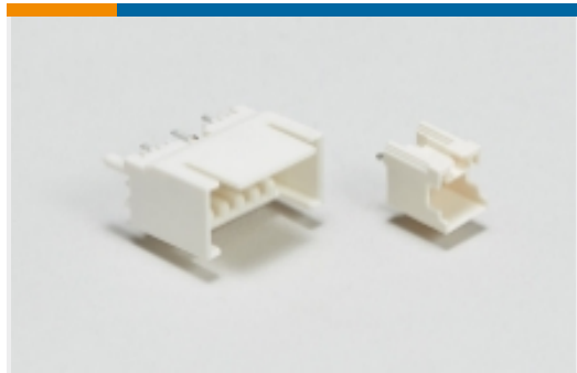
线对板接头和插座(79)