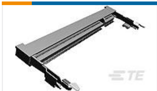
TE 产品编号1746540-4 SEMI-HARD TRAY DDR2 SODIMM 4H STD (LATCH)