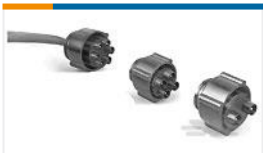
TE 产品编号861648-7 PLUG ASSY HV 7 PIN