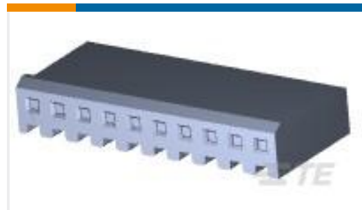
TE 产品编号1-647401-0 10P SL156 HSG W/RAMP,LRG OPEN