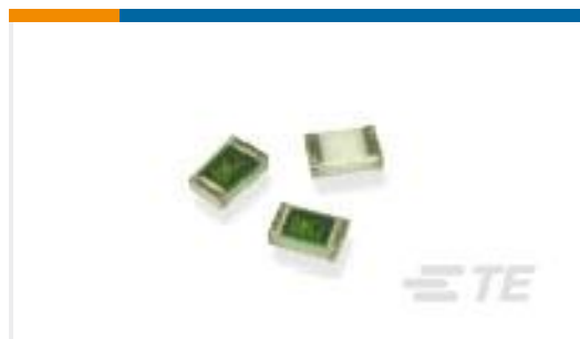
TE 产品编号2-2176087-9 RP 1J 0.166W 133R 0.1% 25PPM 1K RL