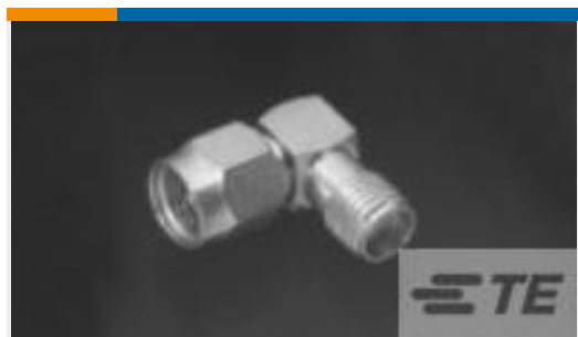
TE 产品编号1055069-1 2088 1230 00