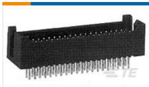
TE 产品编号102567-1 12 MODII 2PC HDR DR SHRD .100