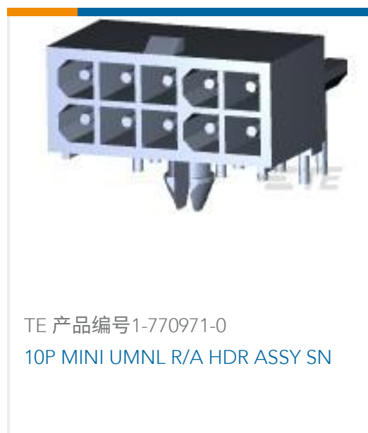
TE 产品编号1-770971-0 10P MINI UMNL R/A HDR ASSY SN