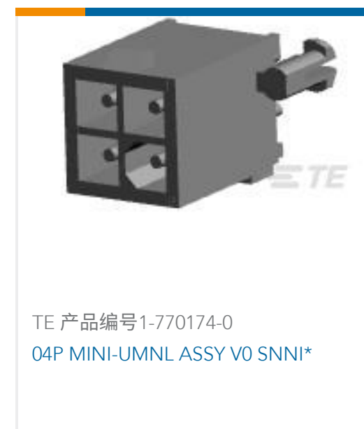
TE 产品编号1-770174-0 04P MINI-UMNL ASSY V0 SNNI*