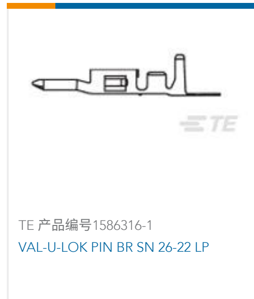
TE 产品编号1586316-1 VAL-U-LOK PIN BR SN 26-22 LP