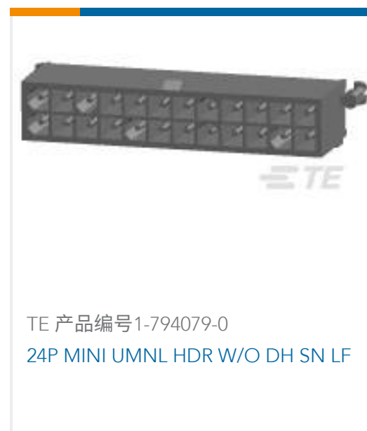
TE 产品编号1-794079-0 24P MINI UMNL HDR W/O DH SN LF