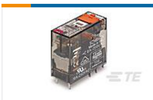
TE 产品编号1887201-3 XT424524