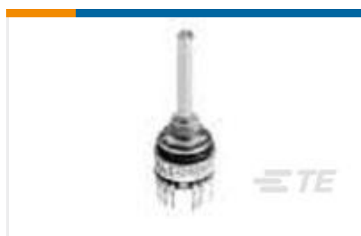
TE 产品编号1825537-2 MRJE2604