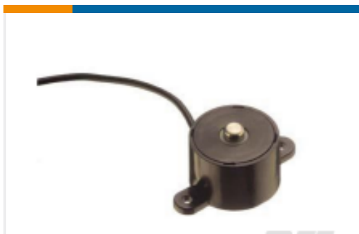
TE 产品编号FC2231-0000-0100-L MID RANGE COMPRESSION SENSOR