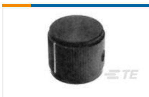
TE 产品编号3-1437622-0 KN1251B1/4=KNOB BLK KNURL L/HA