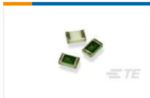
TE 产品编号2-1614884-5 CPF 0805 22R 0.1% 25PPM 1K RL