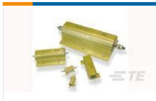
TE 产品编号2-1676625-4 HSA25 34R 5%