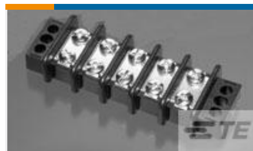
TE 产品编号1546310-8 8P .563" DR BARRIER STRIP