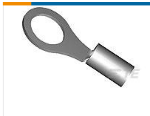
TE 产品编号160293 PLASTI-GRIP, RING, 12-10 5MM