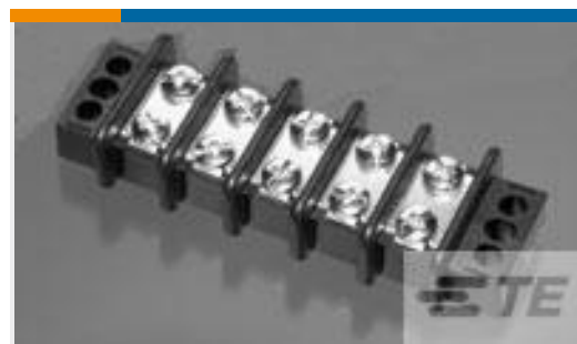
TE 产品编号1546310-6 6P .563" DR BARRIER STRIP