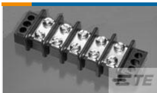
TE 产品编号1546307-4 4P .374" DR BARRIER,W/WASHER