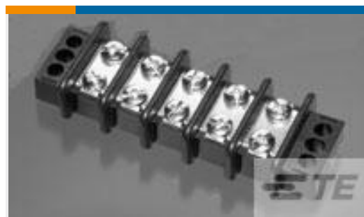
TE 产品编号1546307-6 6P .374" DR BARRIER,W/WASHER