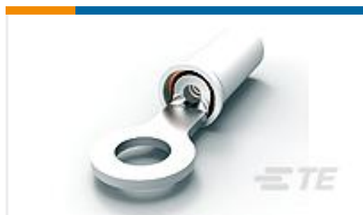
TE 产品编号150493 PIDG, RING, 24-20 4