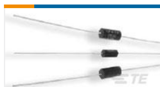
TE 产品编号 1624322-1 UPW25 0.1% 5PPM 100K