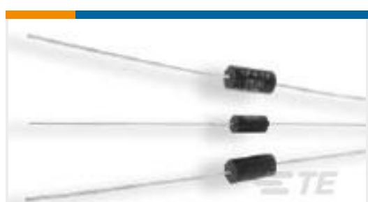
TE 产品编号 1-1624323-0 UPW50 0.1% 5PPM 250R