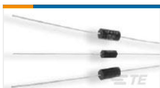
TE 产品编号 1624323-6 UPW50 0.1% 5PPM 1K0