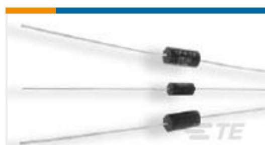
TE 产品编号 1624322-6 UPW25 0.1% 5PPM 250R