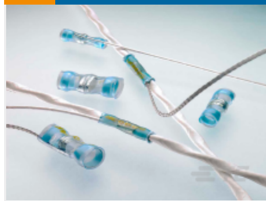
TE 产品编号EJ3520-000 S200-4-55-20-9CS2904