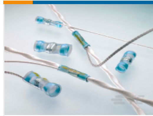
TE 产品编号EJ3523-000 S200-2-55-18-9CS2904