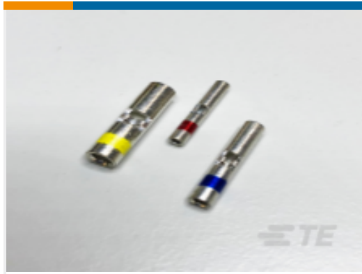
TE 产品编号615669-000 D-609-07CS2717