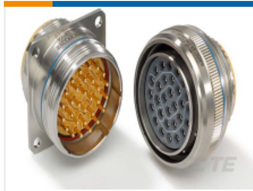
TE 产品编号ZPF000000000037216 983-6SE 24-30 S6 L