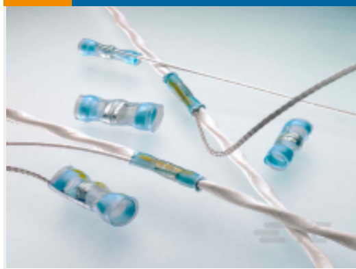
TE 产品编号EJ3525-000 S200-4-55-18-9CS2904