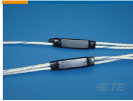
TE 产品编号CW0499-000 D-500-L458-2-4Y3-120