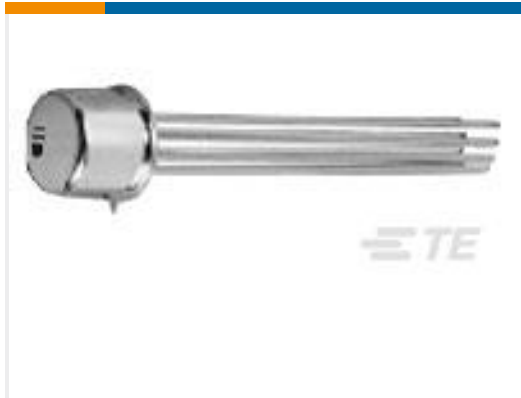
TE 产品编号3-1617119-2 J1MSCD-18XMS = M39016/25-048M