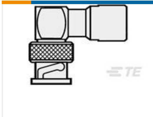
TE 产品编号485251-000 RBD-75-L-01