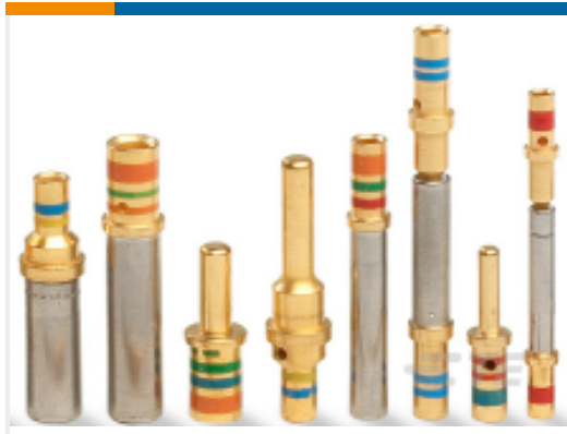
TE 产品编号6560-201-22233 CONT PIN