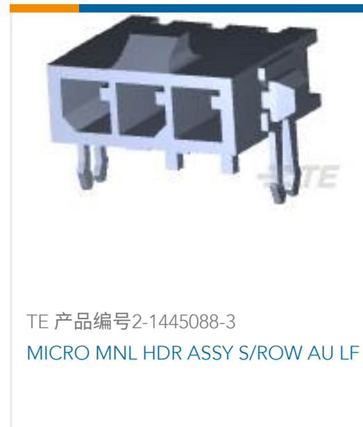
TE 产品编号2-1445088-3 MICRO MNL HDR ASSY S/ROW AU LF