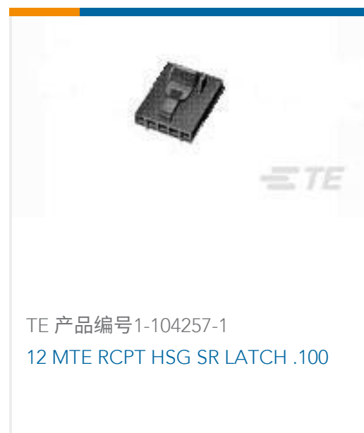
TE 产品编号1-104257-1 12 MTE RCPT HSG SR LATCH .100