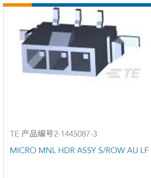
TE 产品编号2-1445087-3 MICRO MNL HDR ASSY S/ROW AU LF