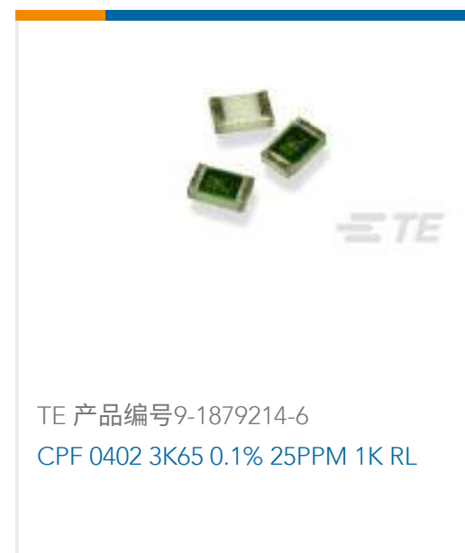
TE 产品编号9-1879214-6 CPF 0402 3K65 0.1% 25PPM 1K RL