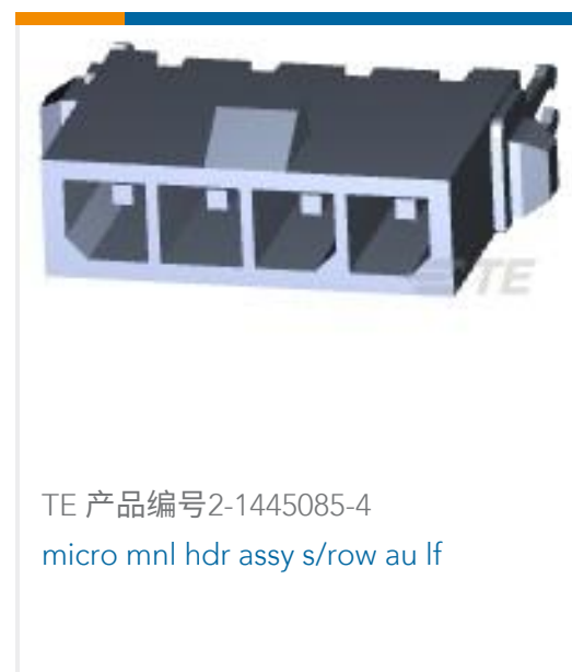
TE 产品编号2-1445085-4 micro mnl hdr assy s/row au lf