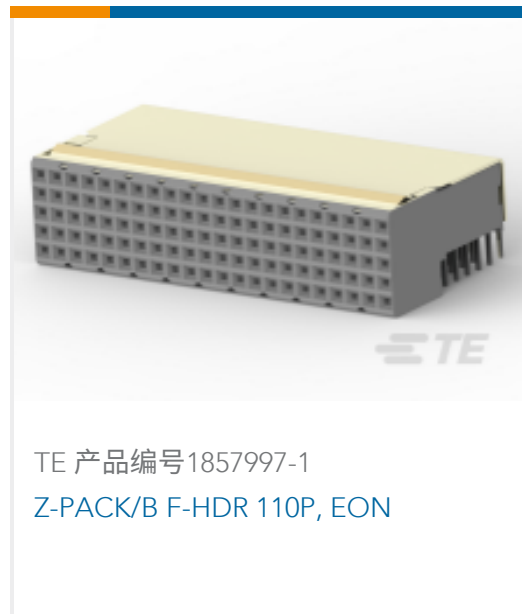
TE 产品编号1857997-1 Z-PACK/B F-HDR 110P, EON