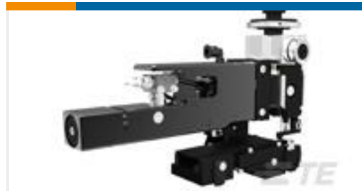
TE 产品编号2151921-2 OCEAN_2.0_APPLICATOR-S-062F0900