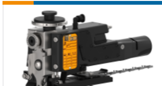
TE 产品编号2150427-2 OCEAN_2.0_APPLICATOR-E-110F140OVA