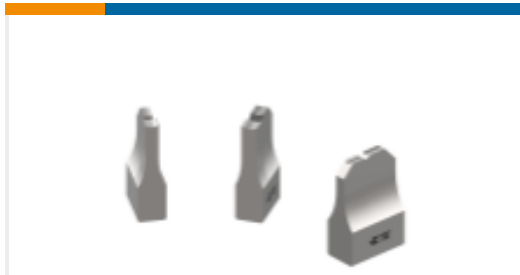
ANVIL REPRESENTATION ONLY