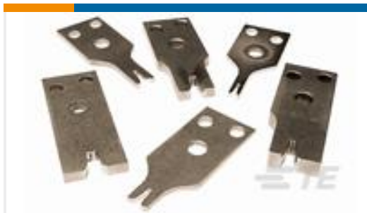
TE 产品编号5-562108-1 WIRE CRIMPER