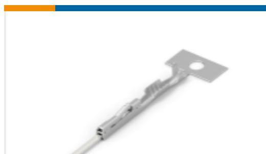
TE 产品编号2236905-3 NANO TAB 0.5X0.4, TERMINAL