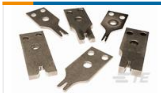
TE 产品编号7-2119784-6 CRIMPER INSULATION O PREMIUM