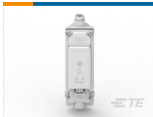
TE 产品编号A17609-000 EKM-1261S-3D1-5X10-1CG-C3