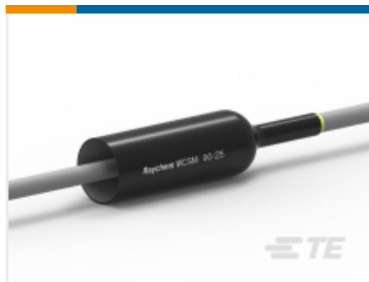
TE 产品编号CU4599-000 WCSM-90/25-700/S(S5)