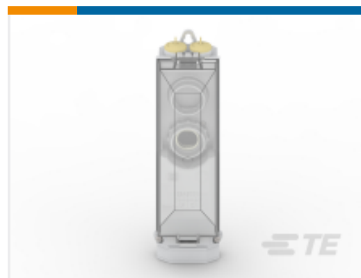
TE 产品编号F41915-000 EKM-2072-1D2-4X35