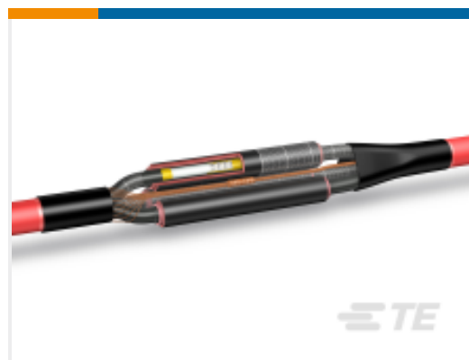
TE 产品编号634139-000 EPKJ-0910-(S5)