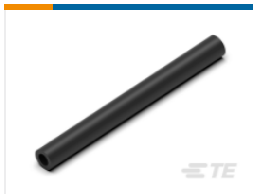
TE 产品编号E00758-000 EN-CGAT-3/1-0-SP