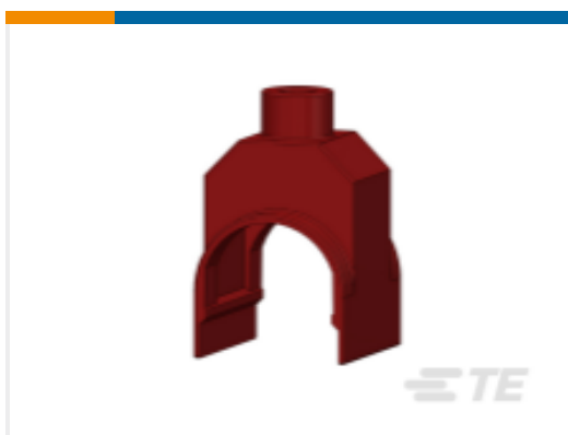
TE 产品编号CF9621-000 HEL-4836 SK(C500)