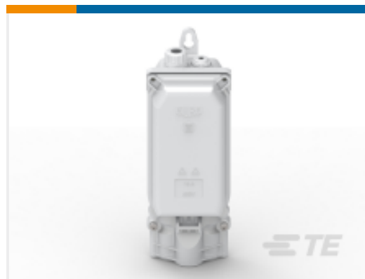
TE 产品编号619568-000 EKM-1281-1D2-5X16-2PG-C3