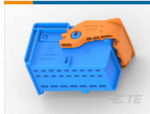
TE 产品编号1-2141846-3 CARRIER,RECEPTACLE HSG, 25POS, ASSY