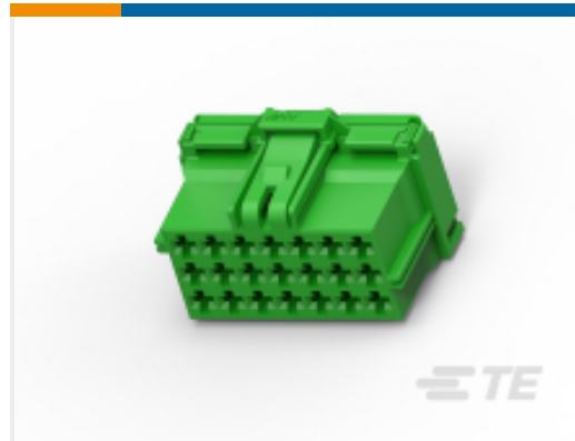
TE 产品编号1-2112890-2 AMP MCP, 非密封连接器壳体