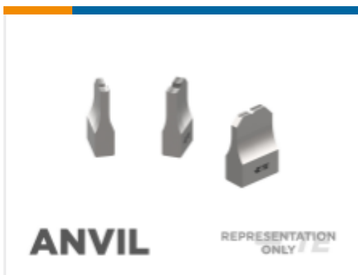
TE 产品编号1-1633928-1 ANVIL COMBINATION