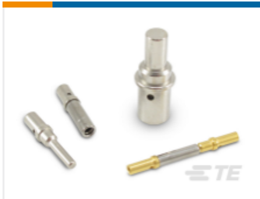
TE 产品编号0462-201-20141 DEUTSCH 实芯端子