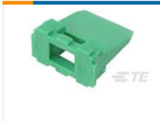
TE 产品编号W6P WEDGE LOCK, 6P, REC, GRN, DT