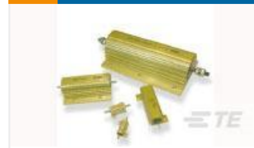
TE 产品编号2-1630024-5 HSC250 6R8 5%