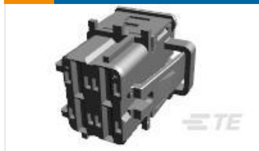
TE 产品编号1534404-2 MCP6.3 RECFP HSG4P