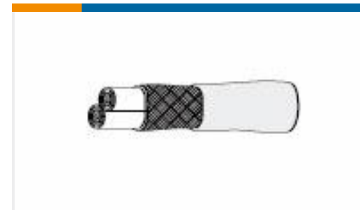
TE 产品编号333001-007 55A1811-22-9-9