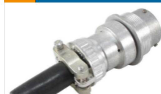
TE 产品编号HD34-18-14SE-059 REC,14P,AL,E, CBL CLMP BT, DRAIN, 16,S,MC