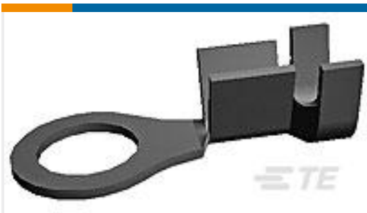
TE 产品编号160787-1 RING TONGUE IS 18-14 AWG .0840 X . 940 BR