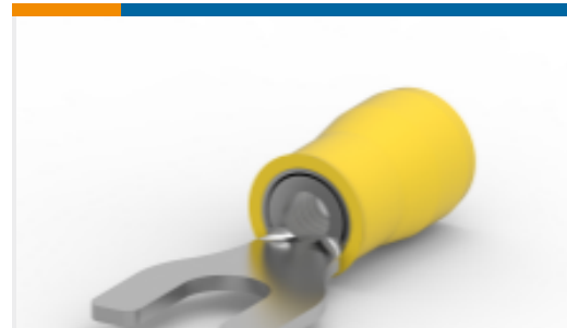
TE 产品编号 35152 TERMINAL,PIDG SPD 12-10 8