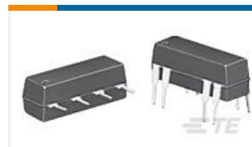
TE 产品编号1393771-7 JWD-171-10=REED RELAYS