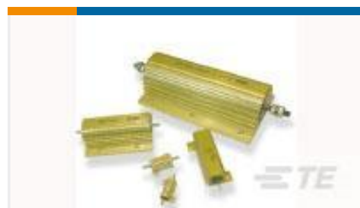
TE 产品编号1625999-3 HSC100 10R 5%