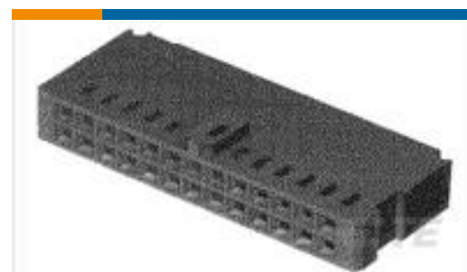
TE 产品编号102387-5 24 MODIV HSG COMP DR .100 POL