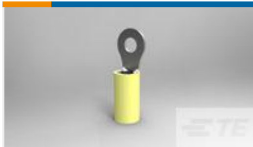
TE 产品编号 2-320568-2 TERM, RT, PIDG IR, 12, #8