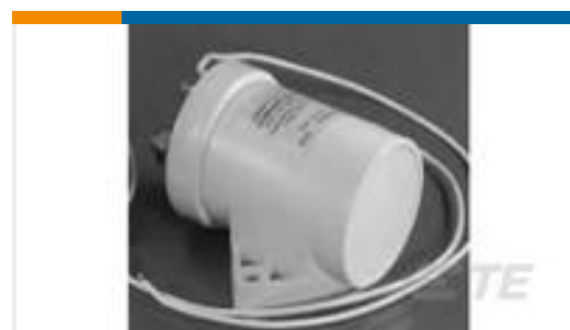
TE 产品编号9-1618384-6 LEV200AOANA = RELAY, LEV200 SPST-NO