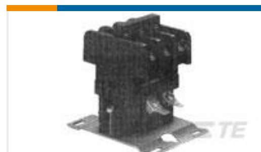
TE 产品编号2-1393132-5 P25P42D22P1-12=CONTACTORS