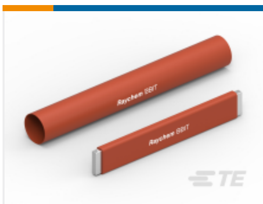
TE 产品编号560936-000 母线绝缘管高达 35 kV