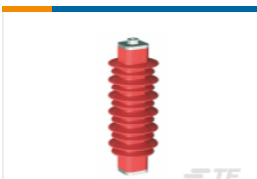
TE 产品编号EN6028-000 HDA-33M-B3-NFF