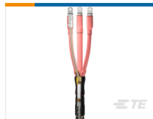
TE 产品编号A31452-070 GUST-12/70-120/800-L12