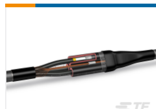
TE 产品编号D11309-070 POLJ-12/3X25-70