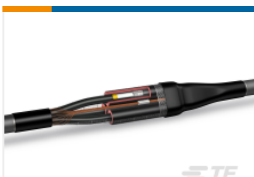
TE 产品编号A69078-064 POLJ-12/3X70-150