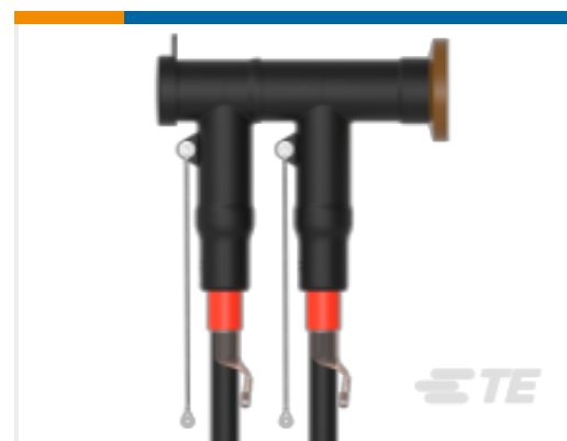
TE 产品编号CM0097-005 RSTI-CC-5854