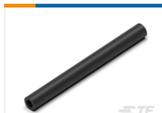
TE 产品编号CN5946-000 EN-CGAT-6/2-0-1200