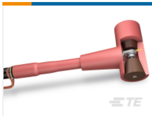
TE 产品编号555340-070 RICS-5123