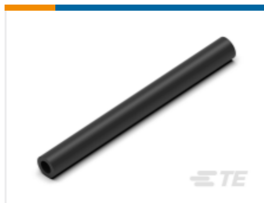
TE 产品编号CN5946-000 EN-CGAT-6/2-0-1200