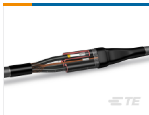
TE 产品编号D11309-070 POLJ-12/3X25-70