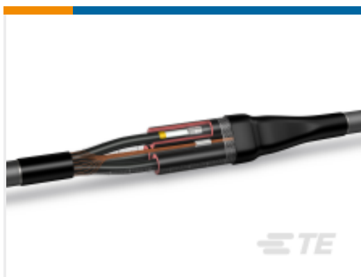
TE 产品编号A69078-064 POLJ-12/3X70-150