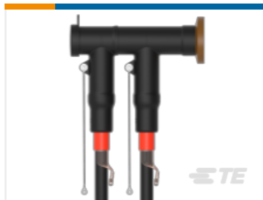
TE 产品编号CM0097-005 RSTI-CC-5854