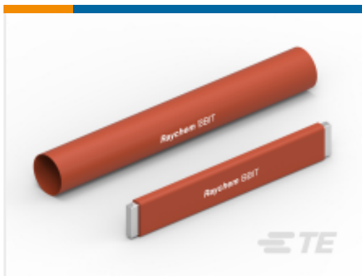
TE 产品编号560936-000 母线绝缘管高达 35 kV