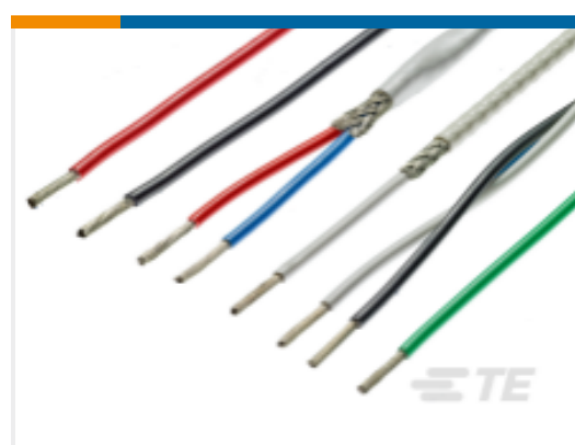
TE 产品编号2823013001 44A0211-8-9