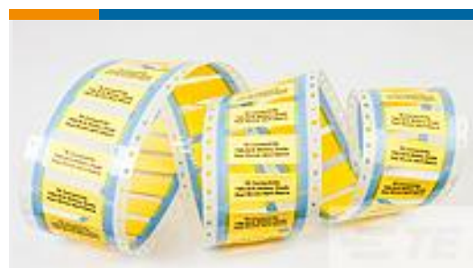
TE 产品编号404545-000 TMS-SCE-1K-3/4-2.0-6