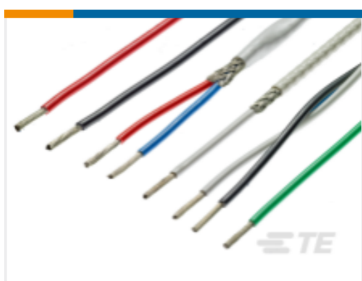
TE 产品编号CQ80093001 44A0211-8-45