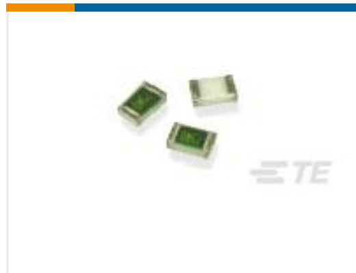
TE 产品编号 6-1879127-7 RN 0402 422R 0.1% 10PPM CUT LENGTH