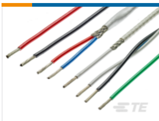
TE 产品编号 2823013001 44A0211-8-9