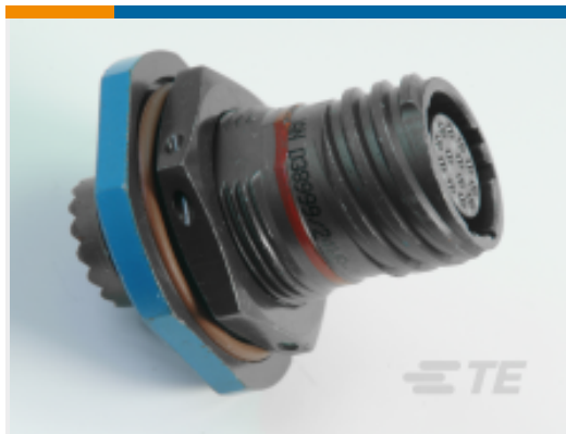
TE 产品编号 YDTS24Z25-19PNV001 RECP ASSY