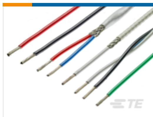
TE 产品编号 CQ80093001 44A0211-8-45