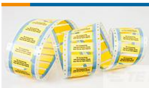
TE 产品编号 404545-000 TMS-SCE-1K-3/4-2.0-6