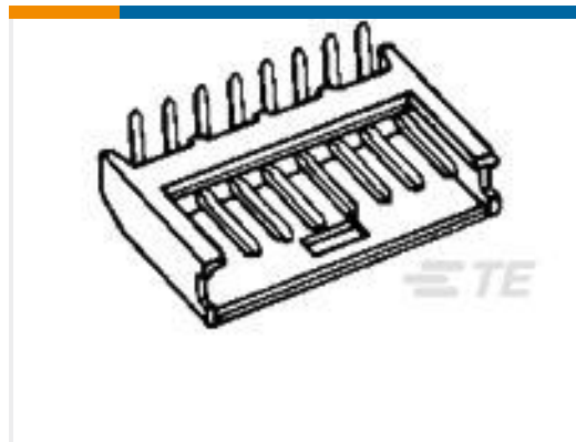
TE 产品编号 280382-1 15P MODU II SHRD HDR, RT ANG, TIN