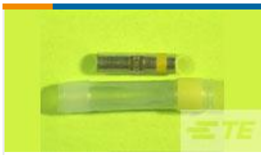
TE 产品编号 650076-000 D-436-38