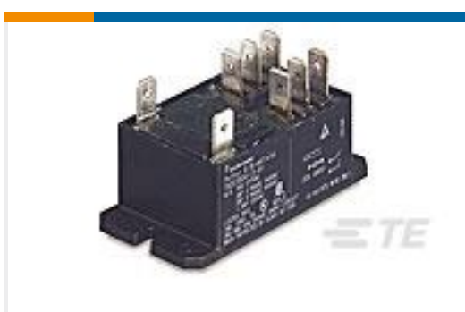
TE 产品编号1393212-4 T92S7A22-24