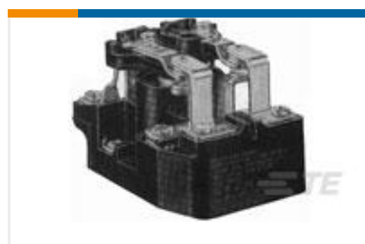
TE 产品编号1393128-5 PRD-5AY0-120=PRD