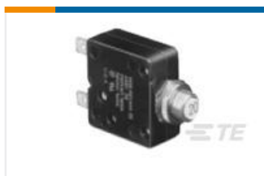
TE 产品编号1393249-7 W58-XB1A4A-10=W58