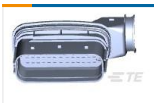
TE 产品编号5-1718323-1 2.8MM TAB HSG.,39POS.,ASSY