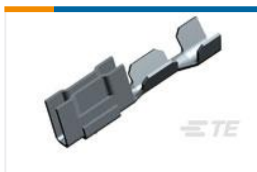
TE 产品编号1445336-2 LOOSE PC CONTACT 15 AU PLATED