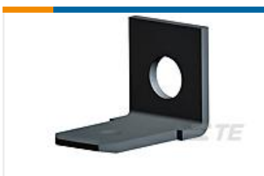
TE 产品编号42095-1 FASTON .250 SERIES (6.3 MM) TAB TPBR