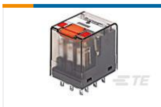
TE 产品编号5-1419111-0 PT270615