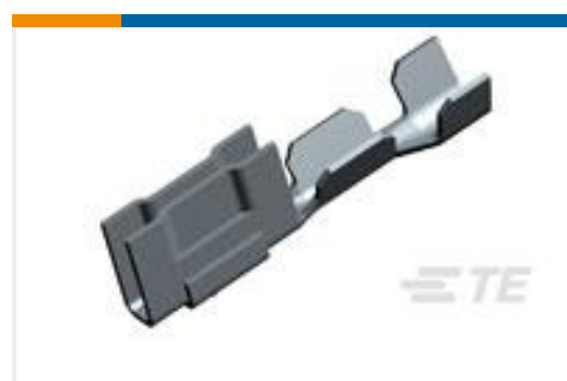
TE 产品编号1445336-3 LOOSE PC CONTACT 30 AU PLATED