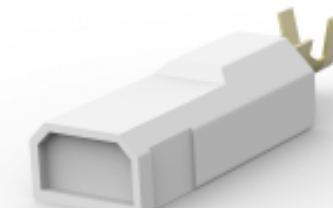
TE 产品编号521747-1 ULTRA-POD 250 ASSY TAB 18-14 AWG BR