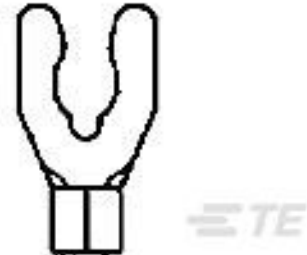
TE 产品编号 53177-1 SOLIS SP SPD 16-14 5