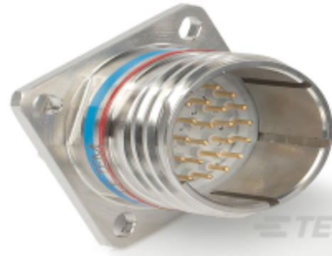
TE 产品编号YDTS20W25-20PNC001 RECP ASSY