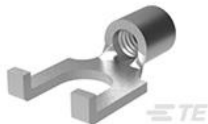
TE 产品编号320857 TERMINAL,SOLIS SPD FLG 16-14