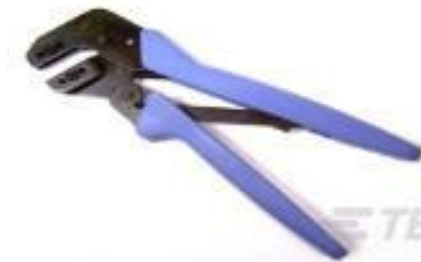
TE 产品编号58637-1 PRO-CRIMP TL & DIE 20-14 UMNL