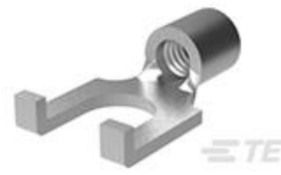
TE 产品编号 2-320857-1 TERMINAL,SOLIS SPD FLG 16-14