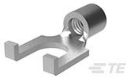
TE 产品编号 320857 TERMINAL,SOLIS SPD FLG 16-14