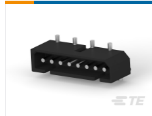
TE 产品编号3-1827158-8 1.25FP,P08,SL,B,C,TR,5.00,5.80