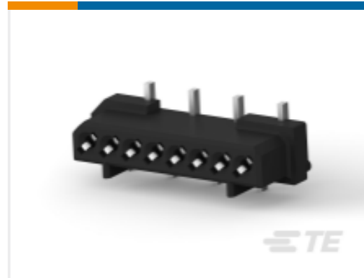
TE 产品编号3-1827159-8 1.25FP,R08,SL,B,C,TR