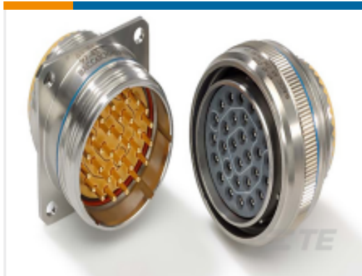
TE 产品编号ZPF00000000007855 983-0YE 10-06 PN