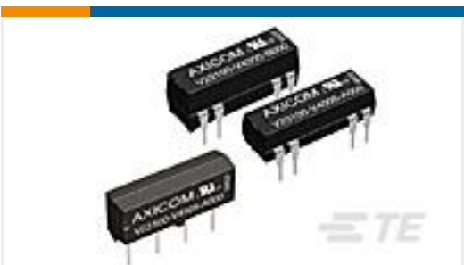
TE 产品编号1393763-1 V23100V4005A