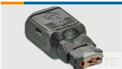
TE 产品编号D369-R33-AS1 369 3 WAY REC, CRIMP, SKT