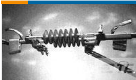
TE 产品编号83843-3 AMPACT ILD Replacement TAP 477.0