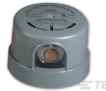
TE 产品编号636452-000 ALR-M-480