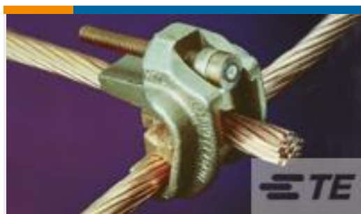
TE 产品编号83750-1 WRENCH-LOK 250-250