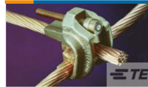
TE 产品编号83749-2 WRENCH-LOK 3/0-3/0, 300-#2