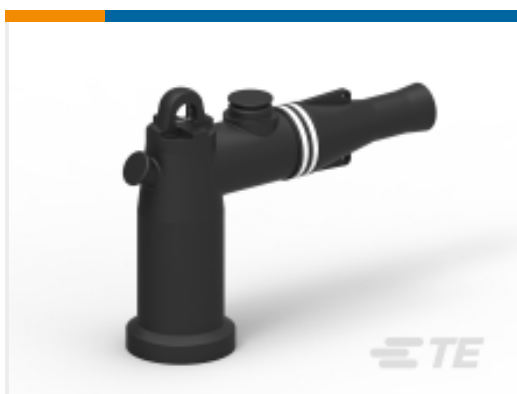
TE 产品编号EE5624-000 ELB-15-210B10