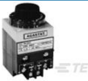
TE 产品编号1423159-3 7012NC=RLY,STD,ON,2P,48VDC,15