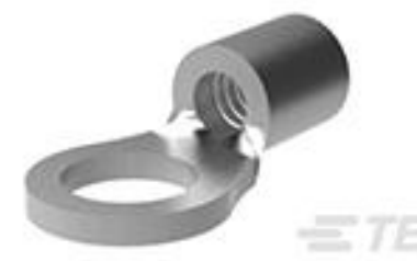
TE 产品编号8-32994-2 TERMINAL,SOLIS R 12-10 8