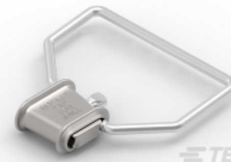
TE 产品编号81667-1 STIRRUP, 1/0, TYPE II AMPACT