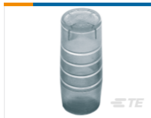
TE 产品编号CN1960-000 GURO-CEC-8/12