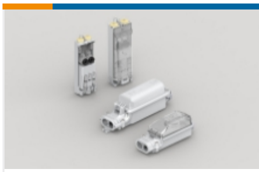
街道照明保险丝盒(201)