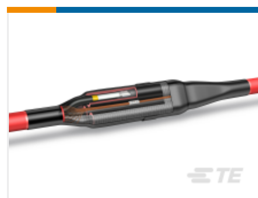
TE 产品编号A76235-000 TRAJ-01/4X150-240/45B