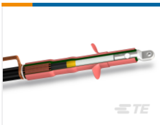
TE 产品编号C82154-013 POLT-12D/1XO