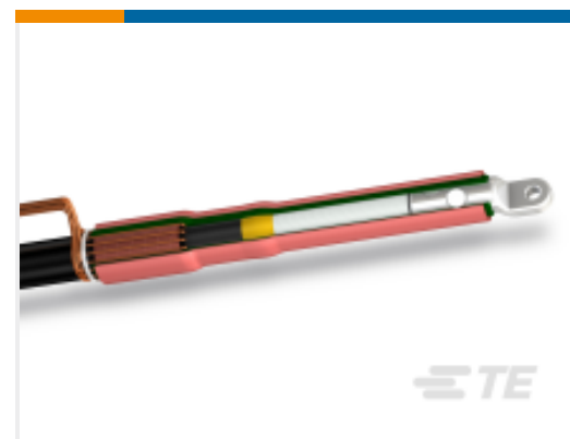
TE 产品编号CF6274-070 POLT-12C/1XI-ML-1-13