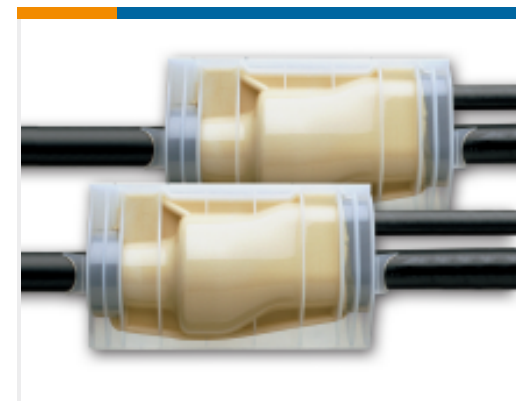
TE 产品编号C57047-000 RAPID-43B-D170