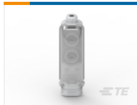
TE 产品编号541838-000 EKM-1272-2D2-4X16