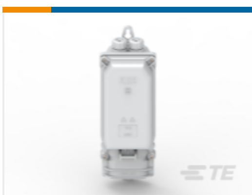
TE 产品编号612804-000 EKM-1281-1D2-5X25-2PG-C2