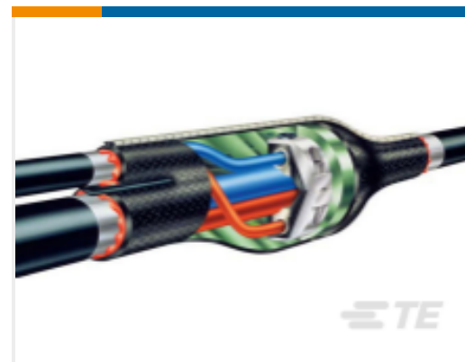
TE 产品编号728079-000 BMHM-1001-4D2