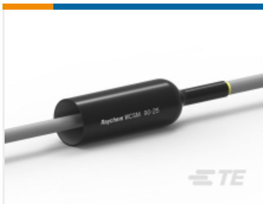
TE 产品编号CU4599-000 WCSM-90/25-700/S(S5)