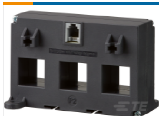
TE 产品编号 BM7634-000 CI-DL3N1-45-600/0.1