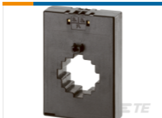
TE 产品编号 EA3334-000 CI-M93L-600/5

该系列中的其他产品 | Crompton Current Transformers