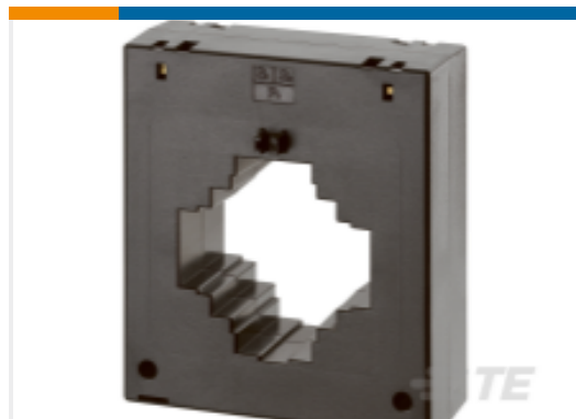
TE 产品编号 EA3289-000 CI-MB5D-600/5