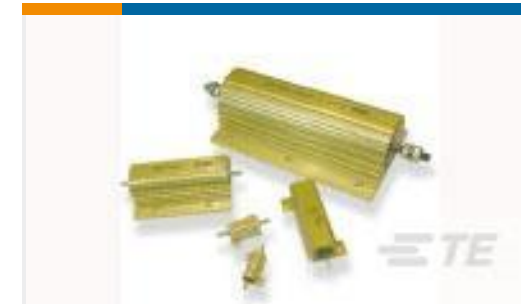
TE 产品编号2-1630024-5 HSC250 6R8 5%