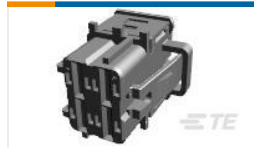
TE 产品编号1534404-2 MCP6.3 RECEPT HSG4P