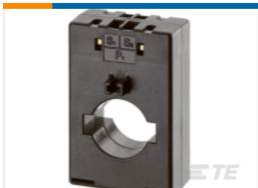
TE 产品编号 EA3324-000 CI-M63N-600/5