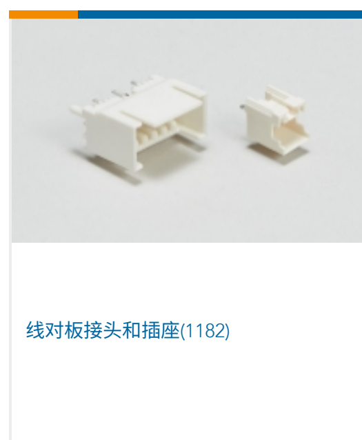
线对板接头和插座(1182)