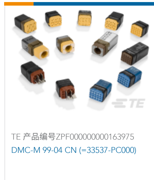
TE 产品编号ZPF000000000163975 DMC-M 99-04 CN (=33537-PC000)