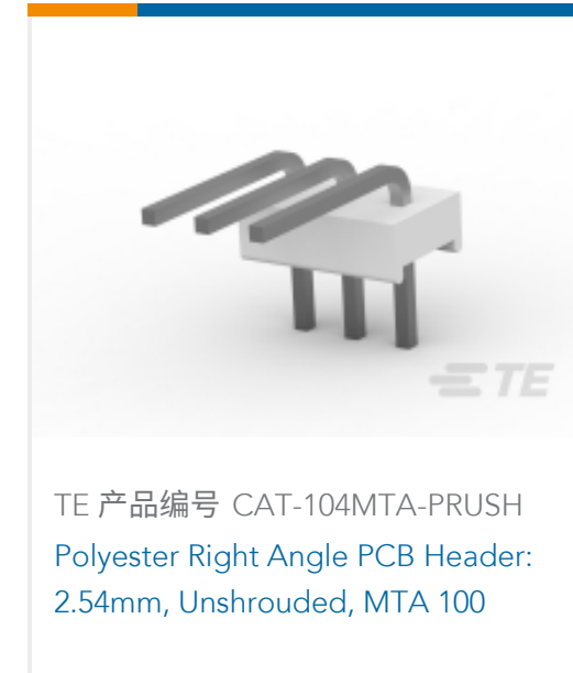
TE 产品编号 CAT-104MTA-PRUSH Polyester Right Angle PCB Header: 2.54mm, Unshrouded, MTA 100