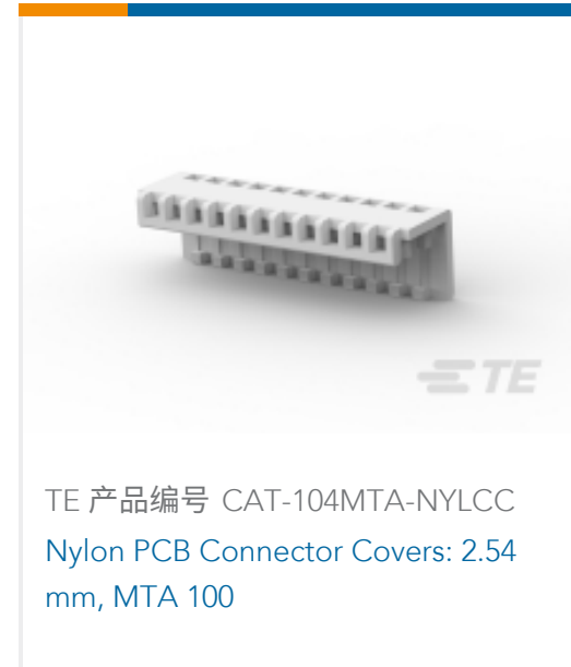
TE 产品编号 CAT-104MTA-NYLCC Nylon PCB Connector Covers: 2.54 mm, MTA 100