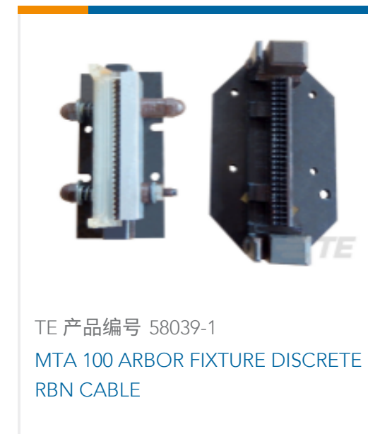
TE 产品编号 58039-1 MTA 100 ARBOR FIXTURE DISCRETE RBN CABLE