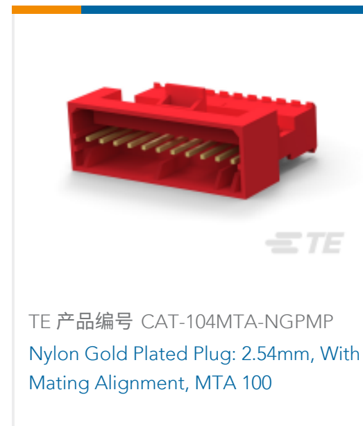
TE 产品编号 CAT-104MTA-NGPMP Nylon Gold Plated Plug: 2.54mm, With Mating Alignment, MTA 100