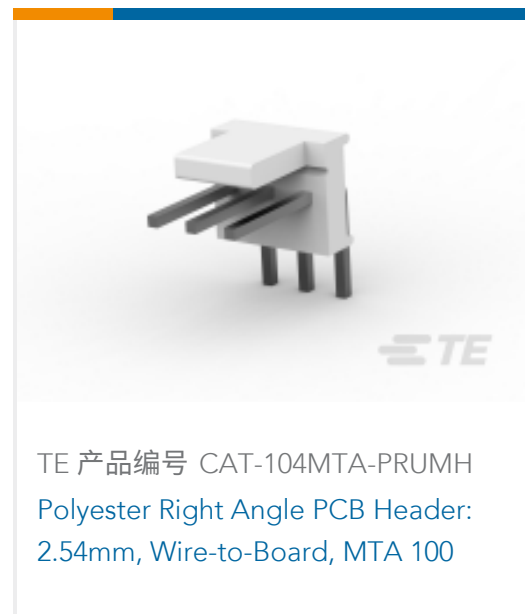
TE 产品编号 CAT-104MTA-PRUMH Polyester Right Angle PCB Header: 2.54mm, Wire-to-Board, MTA 100