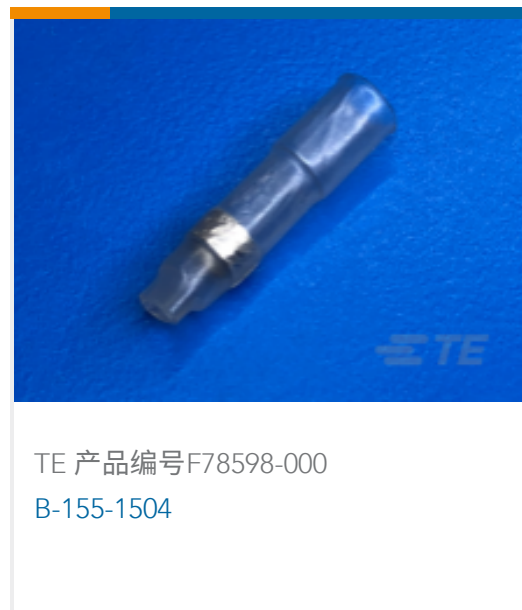
TE 产品编号F78598-000 B-155-1504