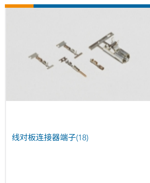
线对板连接器端子(18)