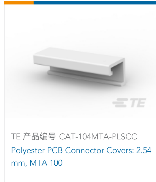
TE 产品编号 CAT-104MTA-PLSCC Polyester PCB Connector Covers: 2.54 mm, MTA 100