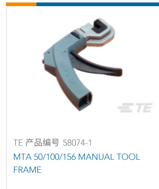
TE 产品编号 58074-1 MTA 50/100/156 MANUAL TOOL FRAME