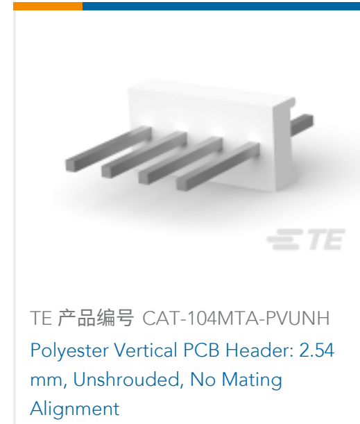
TE 产品编号 CAT-104MTA-PVUNH Polyester Vertical PCB Header: 2.54 mm, Unshrouded, No Mating Alignment