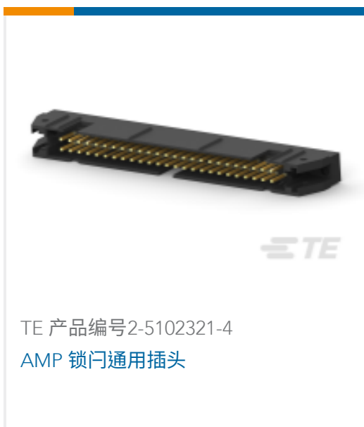
TE 产品编号2-5102321-4 AMP 锁门通用插头