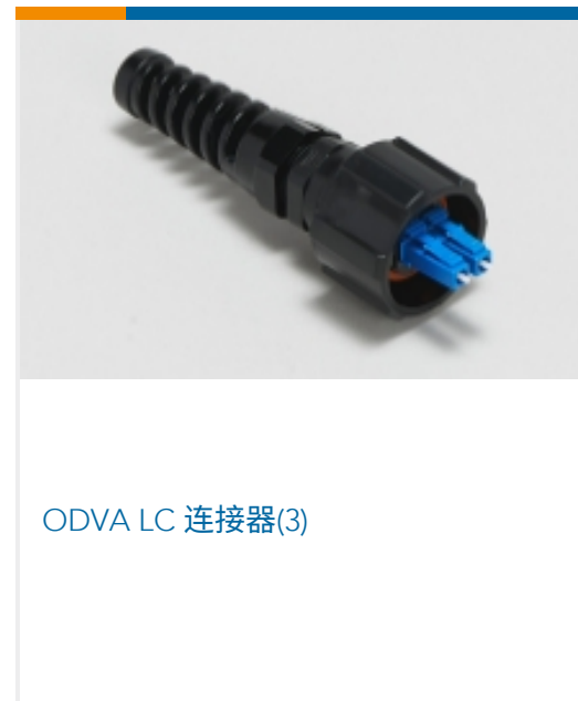
ODVA LC 连接器(3)