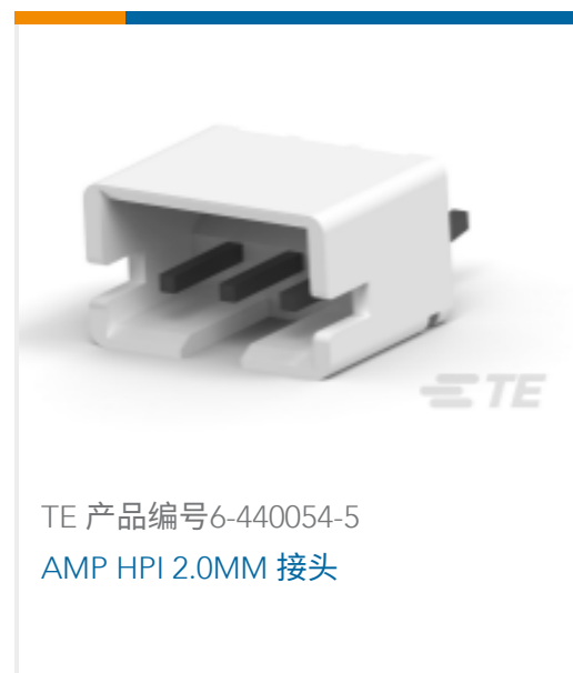
TE 产品编号6-440054-5 AMP HPI 2.0MM 接头