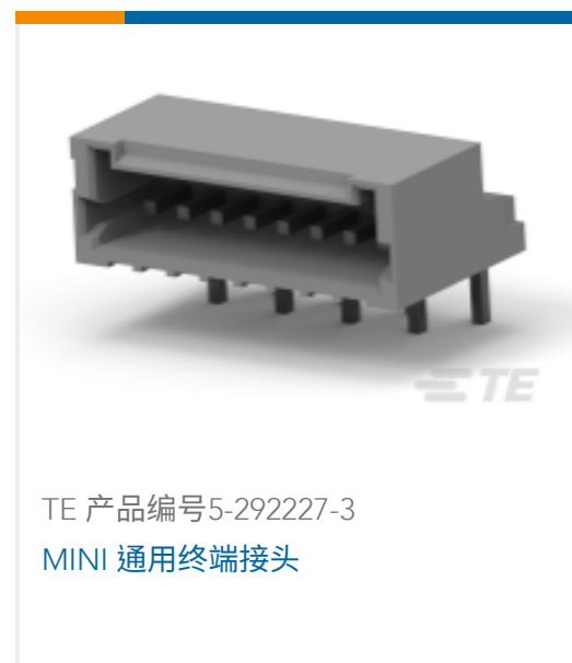
TE 产品编号5-292227-3 MINI 通用终端接头