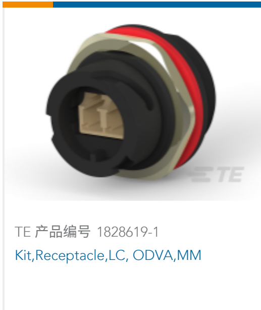
TE 产品编号 1828619-1 Kit, Receptacle, LC, ODVA, MM