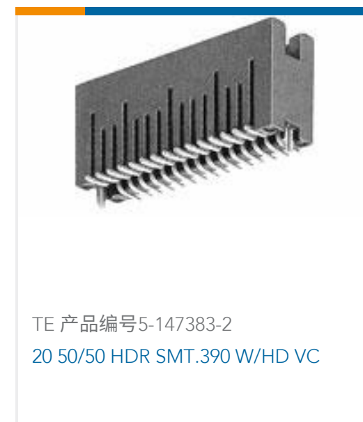
TE 产品编号5-147383-2 20 50/50 HDR SMT.390 W/HD VC