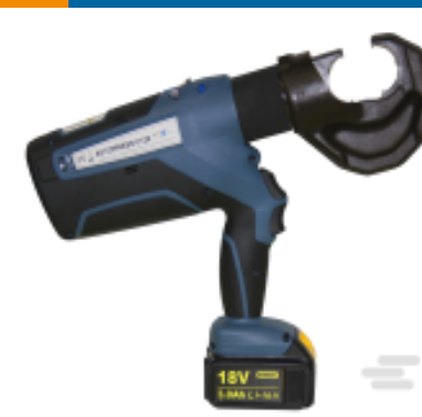
TE 产品编号 2107733-4 AUTOPRESS C120 18V+COF+CHARG 110V