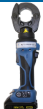
TE 产品编号 2107725-1 AUTOPRESS L62+ COF+CHARG