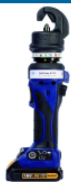
TE 产品编号 2107475-2 UNIPRESS 6/120 +COF+CHARG