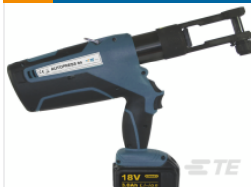
TE 产品编号 2107730-1 AutoPress 80 18V+COF+CHARG