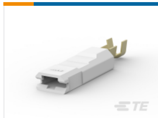
TE 产品编号1969104-1 ULTRA POD：直形，母端组件，无镀层，0.250 英寸