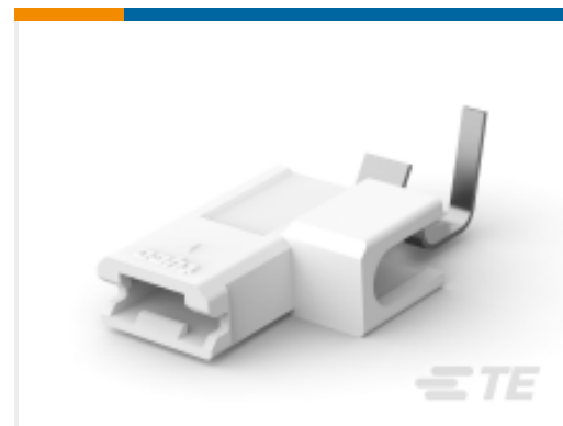
TE 产品编号1969110-2 ULTRA POD：旗形，母端组件，镀锡，0.250 英寸