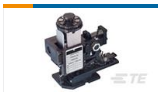
TE 产品编号1852646-1 EFHBPO200TABLOCK.2100 LM/G