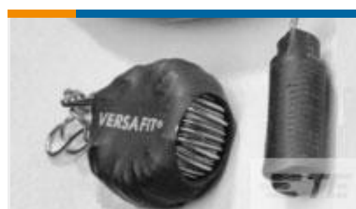
TE 产品编号938365P002 VERSAFIT-1/8-0-0.75IN-ST