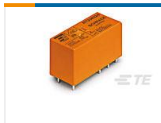
TE 产品编号9-1393239-1 RT314005