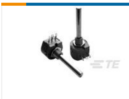
TE 产品编号1676979-4 TW 1W 10K 6.35X25PL