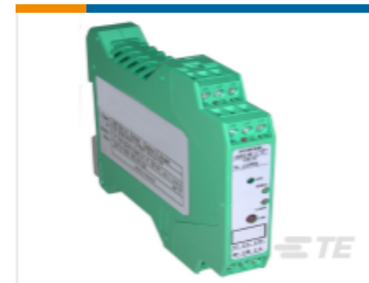
TE 产品编号NEMEME001 WHEASTONE 网桥放大器