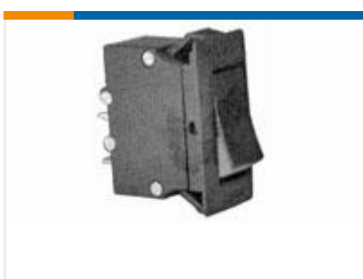
TE 产品编号3-1423673-9 W51-A152A1-5=CKTBKR,THERM,ROC