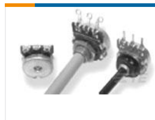
TE 产品编号1623767-2 23E 1MA 6.35X50FL B7 CAT