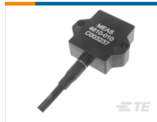
TE 产品编号20004552-00 MEMS 螺钉安装型直流加速度传感器