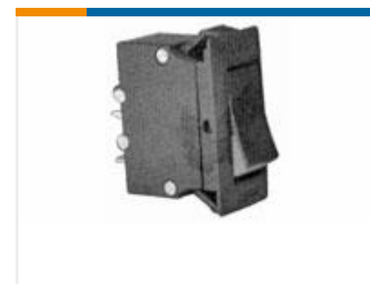
TE 产品编号4-1423673-0 W51-A152A1-10=CKTBKR,THERM, ROC