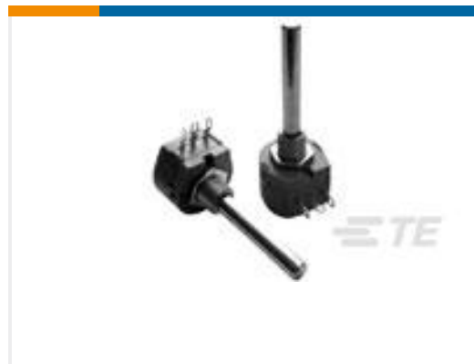
TE 产品编号1676979-4 TW 1W 10K 6.35X25PL