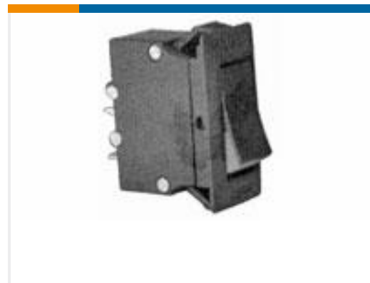
TE 产品编号3-1423673-9 W51-A152A1-5=CKTBKR,THERM,ROC