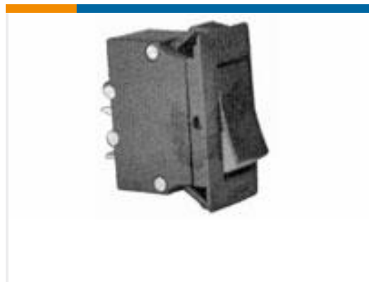
TE 产品编号1-1423673-6 W51-A151A1-7=CKTBKR,THERM, ROC