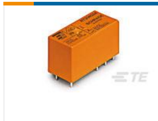
TE 产品编号9-1393239-1 RT314005