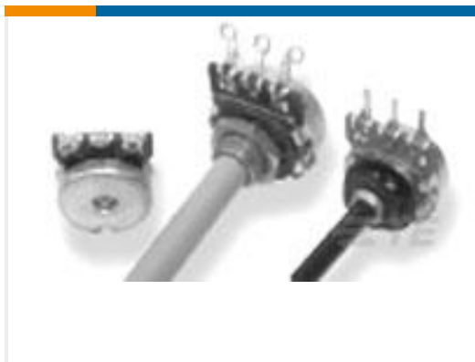
TE 产品编号1623767-2 23E 1MA 6.35X50FL B7 CAT