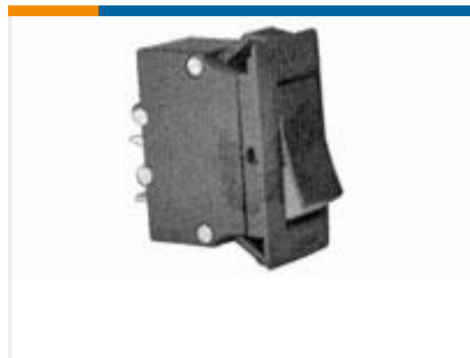
TE 产品编号4-1423673-0 W51-A152A1-10=CKTBKR,THERM, ROC