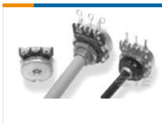
TE 产品编号1623767-2 23E 1MA 6.35X50FL B7 CAT