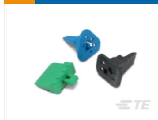
TE 产品编号W6P DEUTSCH DT 楔形锁紧装置