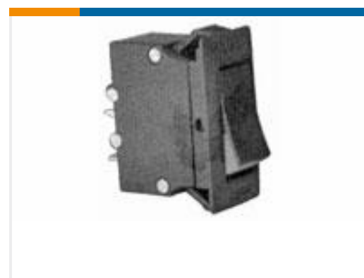
TE 产品编号1-1423673-6 W51-A151A1-7=CKTBKR, THERM, ROCK