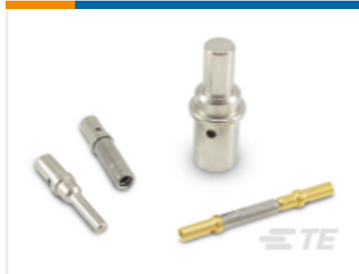
TE 产品编号0462-201-20141 DEUTSCH 实芯端子