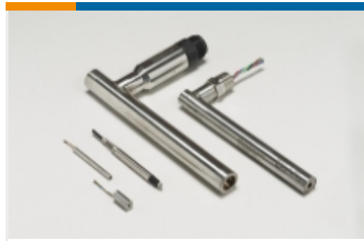
线性位移传感器 - LVDT(7)