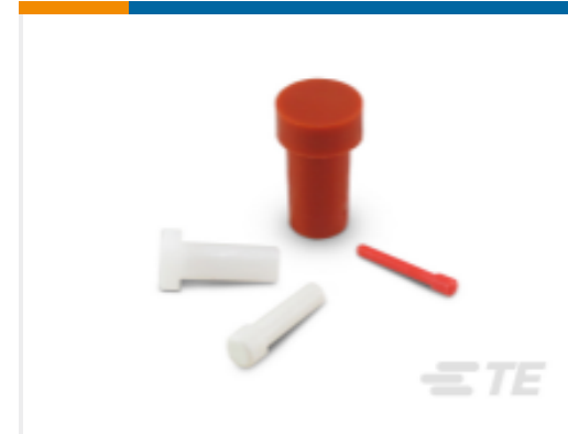
TE 产品编号114017-ZZ DEUTSCH 密封盲堵