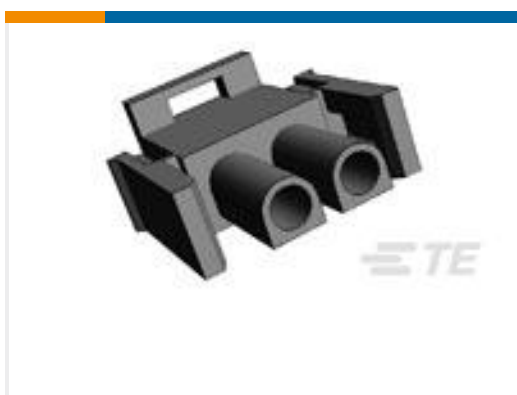
TE 产品编号1-480698-0 02P UMNL PLUG HSG NATL