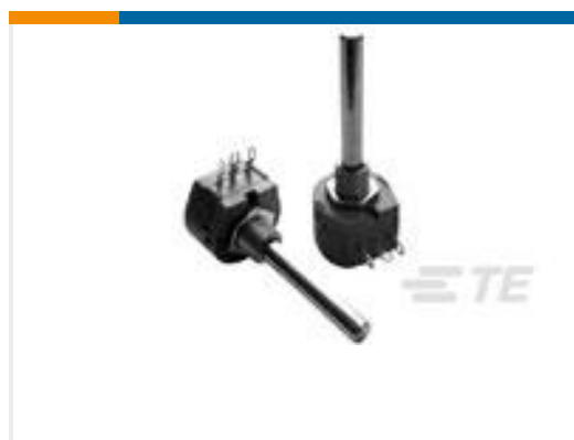
TE 产品编号1676979-4 TW 1W 10K 6.35X25PL