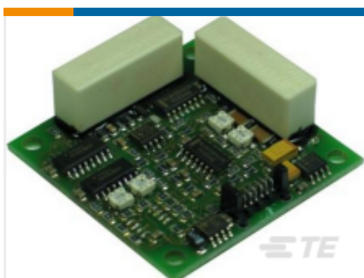
TE 产品编号G-NSMIS-014 CONNECT. MOLEX 6POL 20CM CABLE