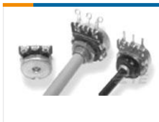
TE 产品编号1623767-2 23E 1MA 6.35X50FL B7 CAT