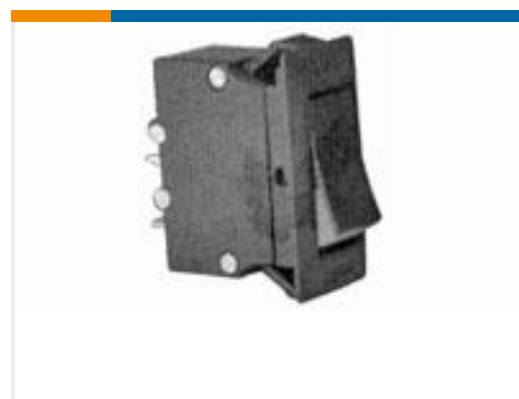
TE 产品编号1-1423673-6 W51-A151A1-7=CKTBKR,THERM, ROCK