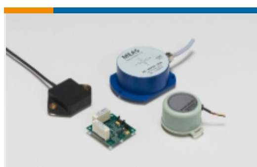
倾角传感器和倾角仪(1)