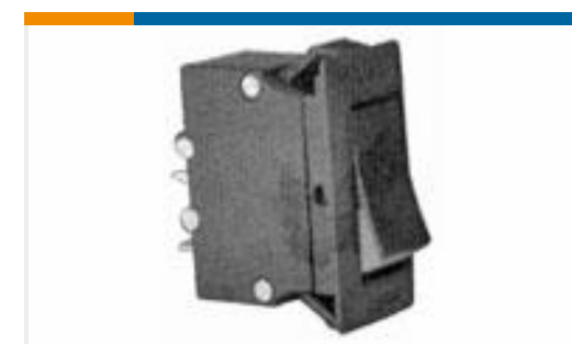
TE 产品编号3-1423673-9 W51-A152A1-5=CKTBKR,THERM,ROC