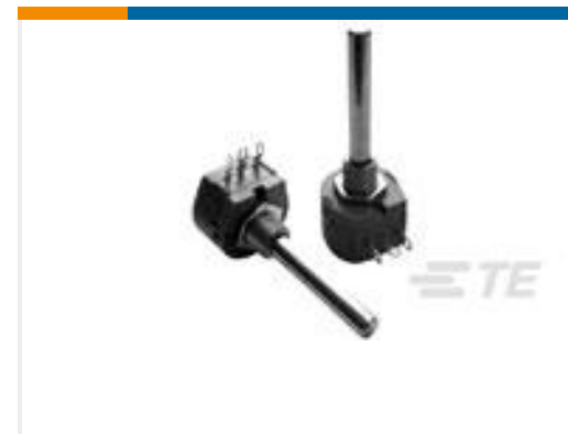
TE 产品编号1676979-4 TW 1W 10K 6.35X25PL