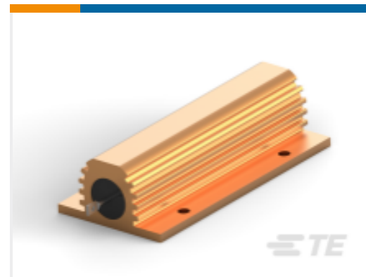
TE 产品编号3-1625999-6 功率电阻器：铝壳体，HSC