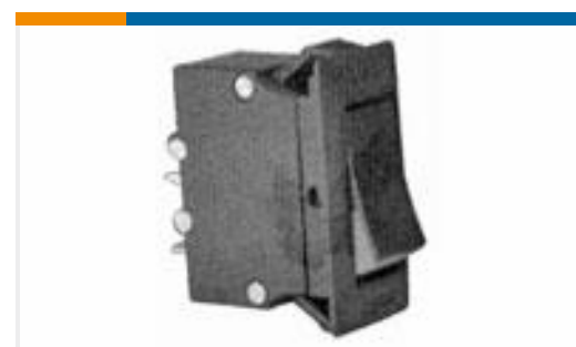
TE 产品编号1-1423673-6 W51-A151A1-7=CKTBKR,THERM, ROC