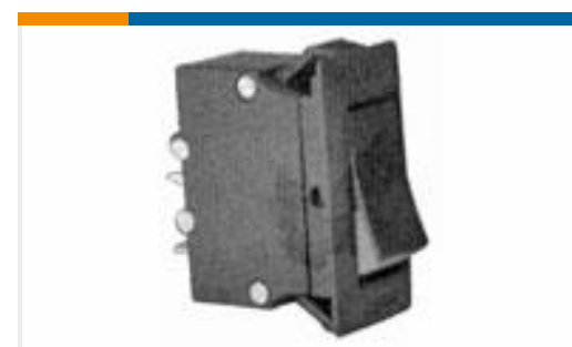
TE 产品编号4-1423673-0 W51-A152A1-10=CKTBKR,THERM, ROC