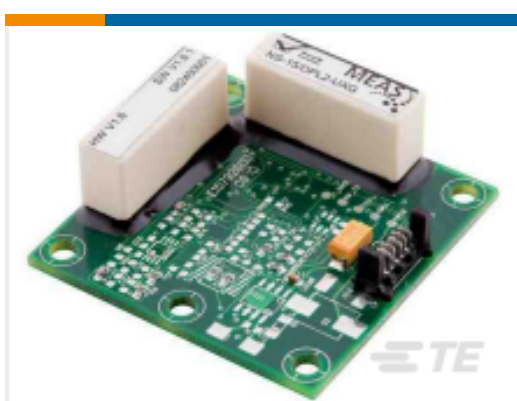
TE 产品编号 G-NSDPL2-022 NS-2/DPN2-RUD