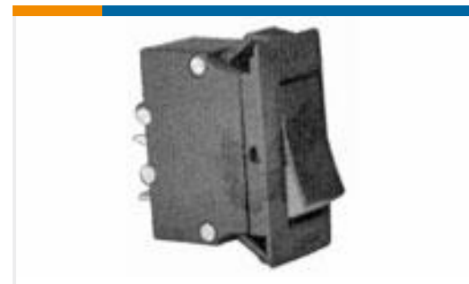
TE 产品编号1-1423673-6 W51-A151A1-7=CKTBKR,THERM, ROCK