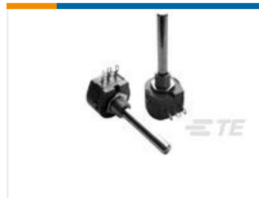
TE 产品编号1676979-4 TW 1W 10K 6.35X25PL