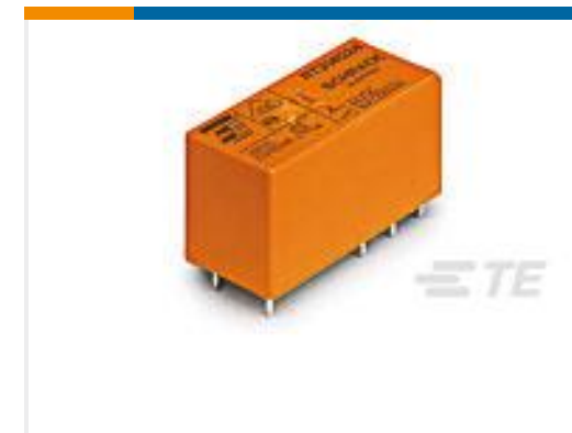
TE 产品编号9-1393239-1 RT314005