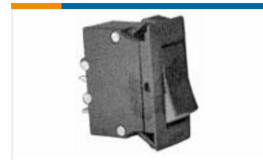
TE 产品编号3-1423673-9 W51-A152A1-5=CKTBKR,THERM,ROC