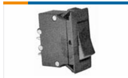
TE 产品编号4-1423673-0 W51-A152A1-10=CKTBKR,THERM, ROC